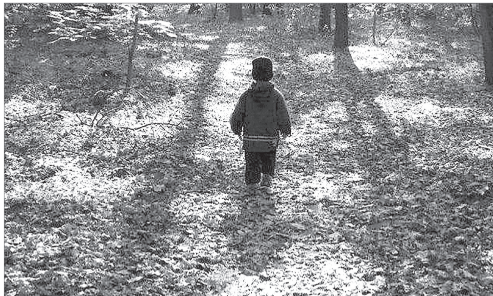
По информации arh112.ru

В это время к поискам уже собирались приступать спасатели Мирнинской службы спасения и полицейские. Никаких травм, если не считать перенесенного стресса, ребенок не получил. Его дядя тоже чувствует себя нормально – он пришел в себя и самостоятельно выбрался к машине.