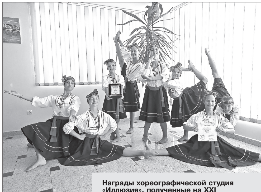
Награды хореографической студии «Иллюзия», полученные на XXI Международном фестивале-конкурсе хореографического искусства и детско-юношеского творчества «Розы Обзора-2019»: