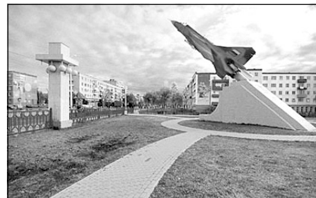
Население 31,9 тыс. жителей. Основан в 1594 году. Первое упоминание в 1567 году. Прежние названия - село Глуховичи. Считается городом с 1957 года. Площадь города - 16,1 кв. км. Телефонный код +7 49663. Почтовые индексы - 140500, 40501. Автомобильные коды - 50, 90, 150, 190. Код OKATO - 46 230 501

Историко-художественный музей. Музей огура.