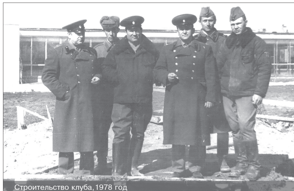
Строительство клуба, 1978 год

Большое внимание уделялось совершенствованию социальной