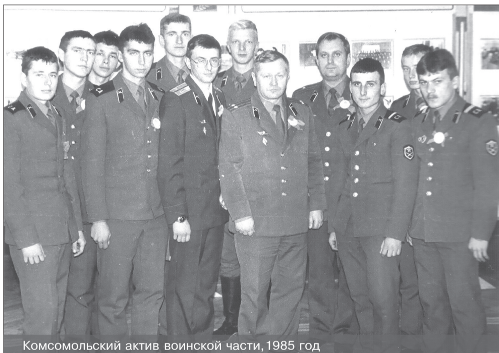
Комсомольский актив воинской части, 1985 год

В 1988 году часть посетил второй космонавт планеты - генерал-полковник Герман Степанович Титов.