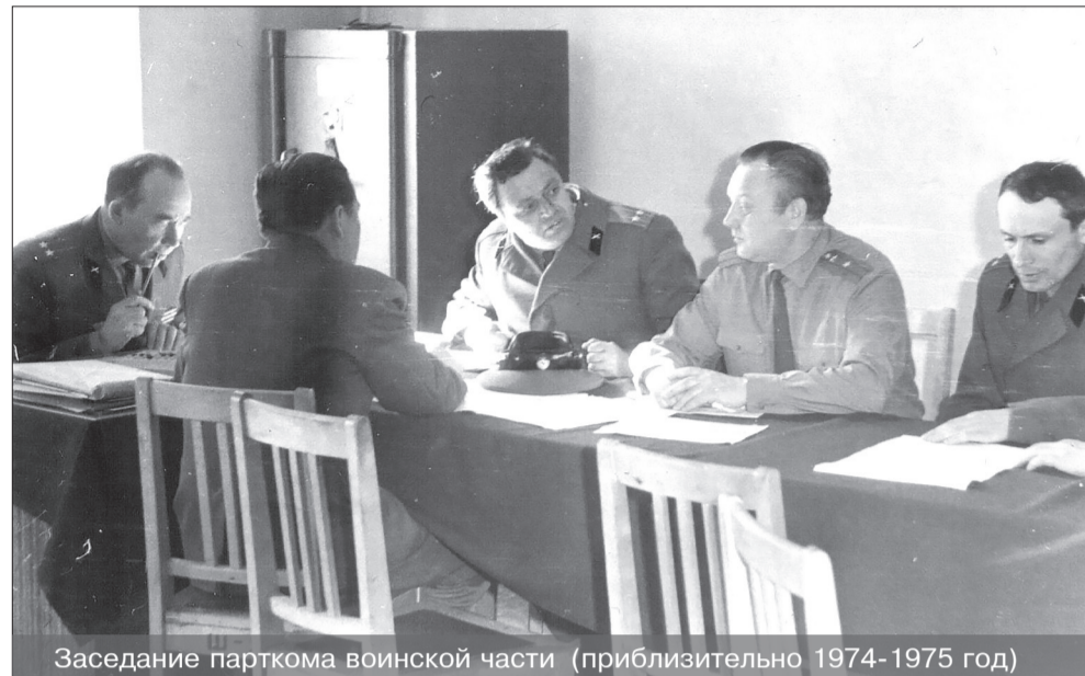
Заседание парткома воинской части (приблизительно 1974-1975 год)

Много внимания уделялось и организации полноценного отдыха личного состава. На военно-политические структуры части возлагалась большая нагрузка по подготовке к посещению части руководителями государства и армии. В 1971-1972 годах часть с инспекцией посетил Министр Обороны СССР Маршал Советского Союза Гречко Андрей Антонович с начальником Генерального Штаба Советской Армии Маршалом Советского Союза Куликовым Виктором Георгиевичем. За