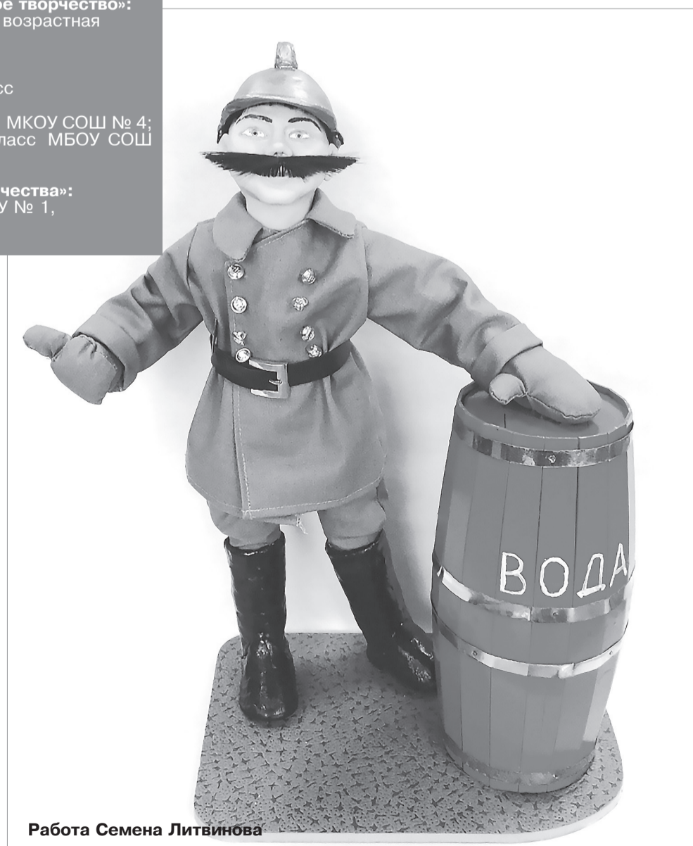
Работа Семена Литвинова