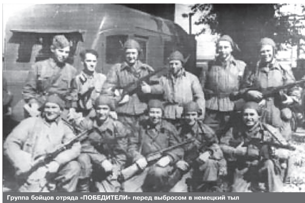
Группа бойцов отряда «ПОБЕДИТЕЛИ» перед выбросом в немецкий тыл

Установлены были, в частности, места дислокации штаба командующего вооруженными силами на Украине генерала авиации Китцингера, штаба главного интеллигентства, хозяйственного штаба группы армий «Юг», штаба командующего так называемыми «Восточными войсками», многих других учреждений оккупантов.