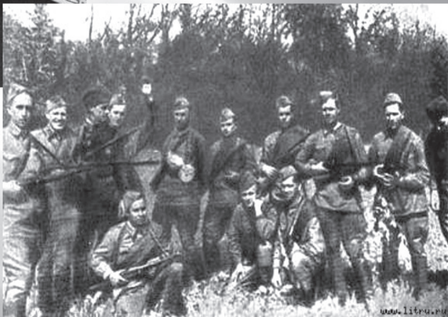
Группа бойцов отряда «ПОБЕДИТЕЛЬ»