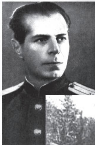
Герой Советского Союза Дмитрий Николаевич Медведев

Материал предоставлен отделом ФСБ в/ч 13990 (по материалам открытых источников печати)