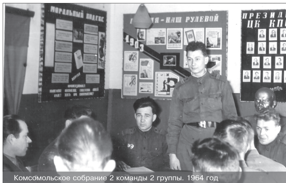
Комсомольское собрание 2 команды 2 группы. 1964 год

Истинный замполит везде успева-ет: и в казарме с военнослужащими поговорит, и на войсковом стрельбище при проведении стрельб поддержит словом молодых солдат, и при подготовке и пуске ракеты он всегда на месте. Живой, энергичный, вездесущий, по-военному несколько суховатый, он всегда заботится о под-