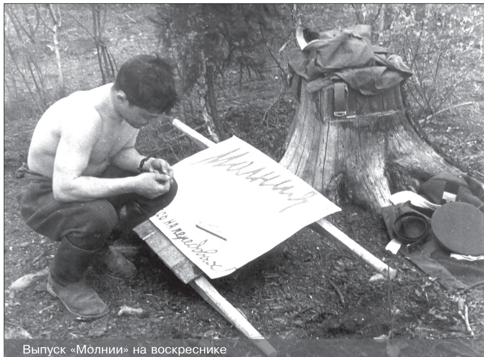
Выпуск «Молнии» на воскреснике