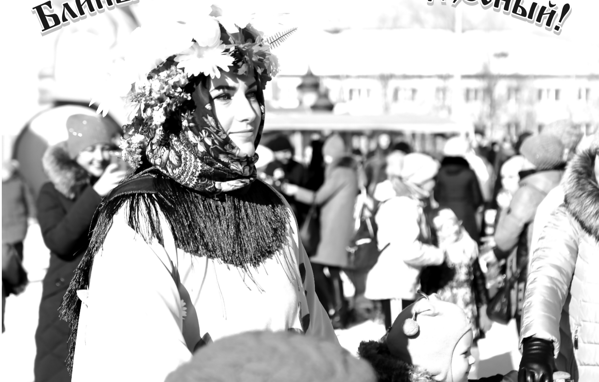
Подробный репортаж читайте в следующем номере