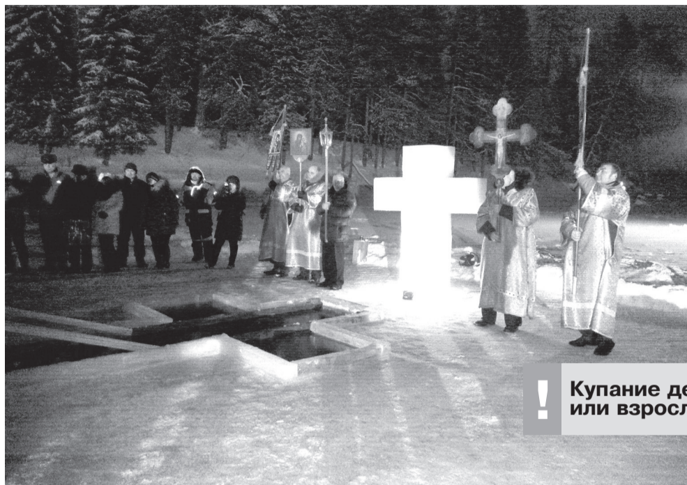
Перед погружением в иордань не выпивайте ни капли спиртного, алкоголь только поможет быстрому переохлаждению и даст лишнюю нагрузку на сердце.

Для повышения собственной холодоустойчивости можно за полтора-два часа до крещенского «заплыва» выпить столовую ложку рыбьего жира с ломтиком хорошо посоленного черного хлеба или кусочком лимона.