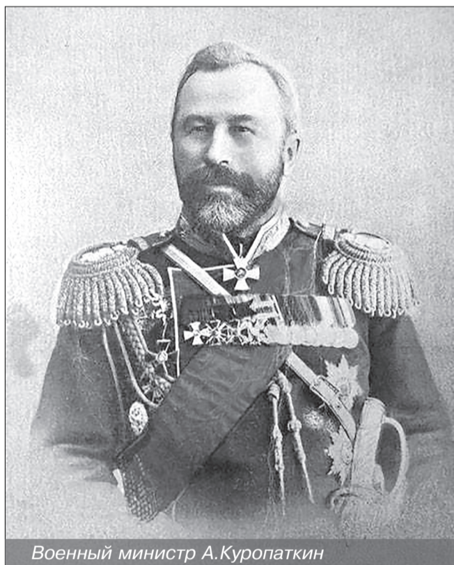
Военный министр А. Куропаткин

В частности, перед началом Русско-японской войны, в Главном управлении Генштаба военного министерства Российской империи был подготовлен проект по учреждению особого органа, который занимался бы поиском и выявлением иностранных шпионов и их пособников со стороны российских подданных. Проект готовился под началом военного министра и члена Военного совета генерал-адъютанта Алексея Куропаткина.