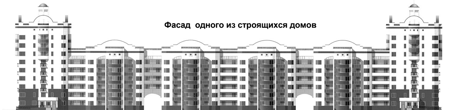
Фасад одного из строящихся домов