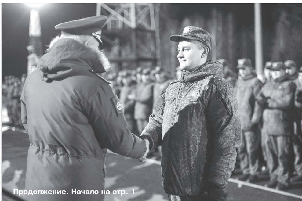
Продолжение. Начало на стр. 1