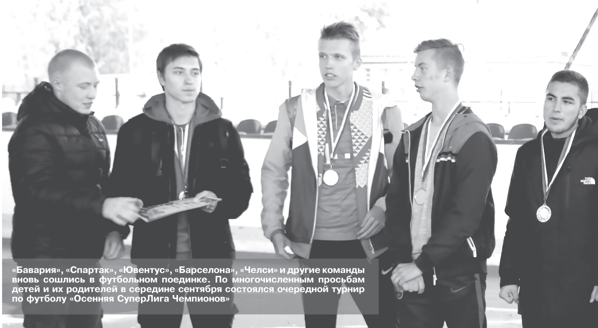
«Бавария», «Спартак», «Ювентус», «Барселона», «Челси» и другие команды вновь сошлись в футбольном поединке. По многочисленным просьбам детей и их родителей в середине сентября состоялся очередной турнир по футболу «Осенняя СуперЛига Чемпионов»