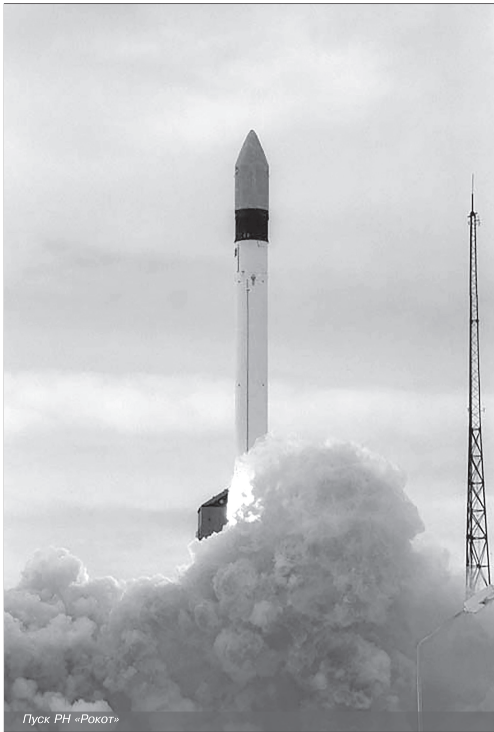
Пуск РН «Рокот»

По итогам же учебного года 1998-1999 школа контактных единоборств Мирного была признана лучшей среди школ России. Были выиграны Международный и Всероссийский турниры по армейскому рукопашному бою. Сертификат об окончании школы начал давать льготы при поступлении в Военный институт физкультуры