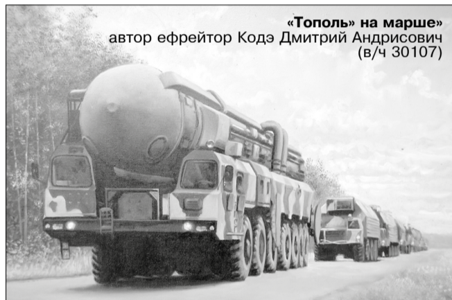
«Тополь» на марше» автор ефрейтор Кодэ Дмитрий Андрисович (в/ч 30107)