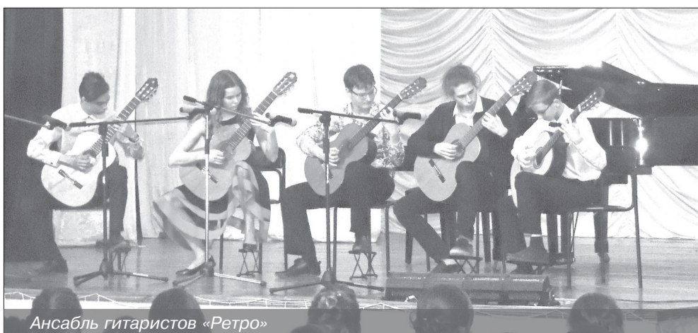
Ансамбль гитаристов «Ретро»