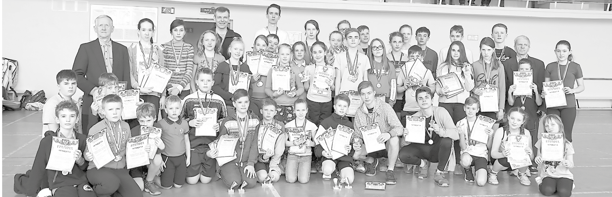
7 и 8 апреля в спорткомплексе «Звезда» проходило открытое первенство города по бадминтону на «Кубок Главы Мирного», посвященное Дню космонавтики. В соревнованиях приняли участие 56 спортсменов разных возрастов. Конкуренцию мирянам на сей раз составили только архангелогородцы, но соперничество было напряженным

Первенство по бадминтону традиционно проводится в течение двух соревновательных дней. В субботу состоялся парад-открытие и прошли игры в одиночном и парном разрядах, а воскресенье было посвящено состязаниям в смешанном разряде и награждению победителей.