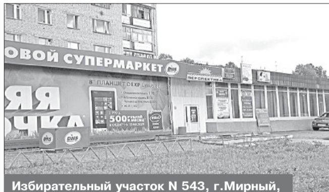
Избирательный участок N 543, г. Мирный, ул. Ленина, 9, ЦО «Перспектива»

Место нахождения участковой избирательной комиссии и помещения для голосования: встроено - пристроенное помещение дома, некоммерческое образовательное учреждение «Центр образования «Перспектива», кабинет № 1, 1-й этаж.