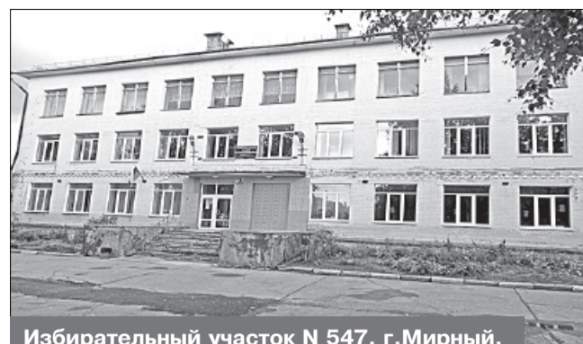
Избирательный участок N 547, г. Мирный, ул. Неделина, 28 (бывшее здание МБОУ СОШ N1)

Место нахождения участковой избирательной комиссии и помещения для голосования: здание муниципального предприятия муниципального образования «Мирный» «Муниципал-сервис», 2-й этаж, помещение актового зала.