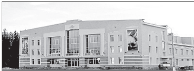
Избирательный участок N 545, г. Мирный, ул. Ленина, 22, Дом офицеров гарнизона

Место нахождения участковой избирательной комиссии и помещения для голосования: здание Федерального государственного казенного учреждения культуры и искусства Министерства обороны Российской Федерации (123-й Дом офицеров (гарнизона)), помещение танцевального зала, 3-й этаж.