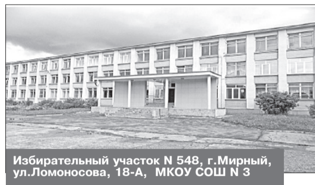
Избирательный участок N 548, г. Мирный, ул. Ломоносова, 18-А, МКОУ СОШ N 3

Место нахождения участковой избирательной комиссии и помещения для голосования: здание муниципального казенного образовательного учреждения средней образовательной школы № 3 города Мирного Архангельской области, 2-й этаж, помещение столовой.