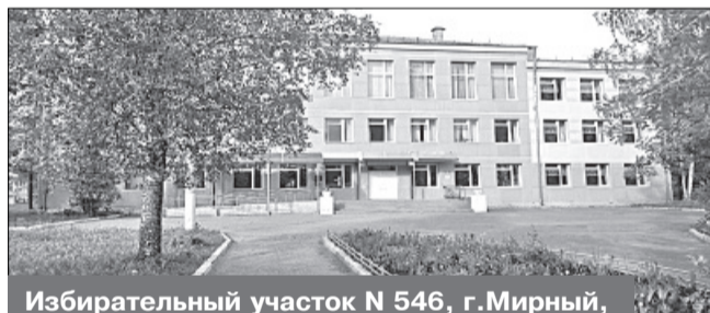
Избирательный участок N 546, г. Мирный, ул. Овчинникова, 11, МКОУ СОШ N 12

Место нахождения участковой избирательной комиссии и помещения для голосования: здание муниципального казенного образовательного учреждения средней образовательной школы № 12 города Мирного Архангельской области, 1-й этаж, помещение спортивного зала.