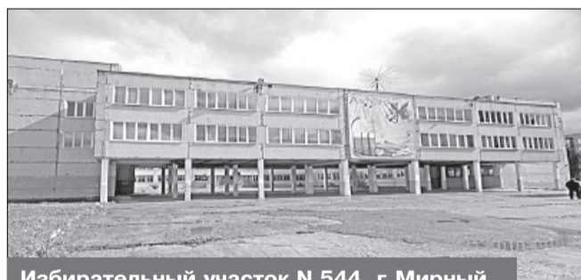
Избирательный участок N 544, г. Мирный, ул. Дзержинского, 8, МКОУ СОШ N 4

Место нахождения участковой избирательной комиссии и помещения для голосования: здание муниципального казенного образовательного учреждения средней образовательной школы № 4 города Мирного Архангельской области, 2-й этаж, помещение актового зала.