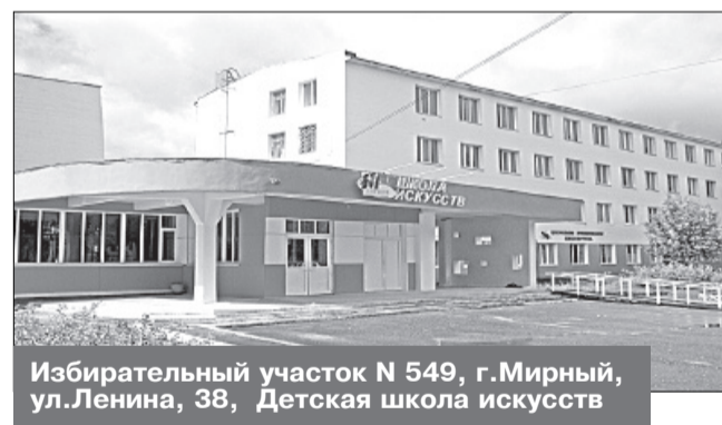
Избирательный участок N 549, г. Мирный, ул. Ленина, 38, Детская школа искусств

Место нахождения участковой избирательной комиссии и помещения для голосования: здание муниципального казенного образовательного учреждения дополнительного образования детей детской школы искусств города Мирного Архангельской области, 1-й этаж, фойе школы.