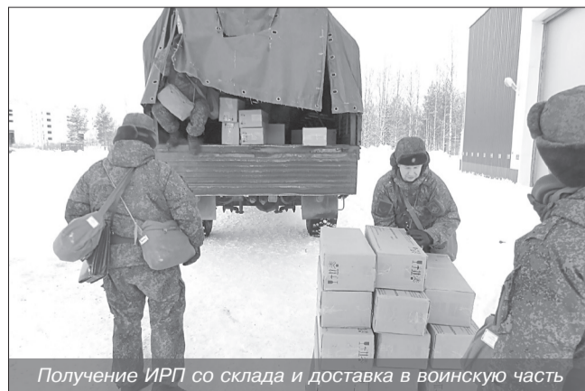
Получение ИРП со склада и доставка в воинскую часть

Основное внимание при проведении указанных мероприятий было направлено на совершенствование практических навыков должностных лиц органов управления, воинских частей и подразделений на знание личным составом обязанностей соглас-