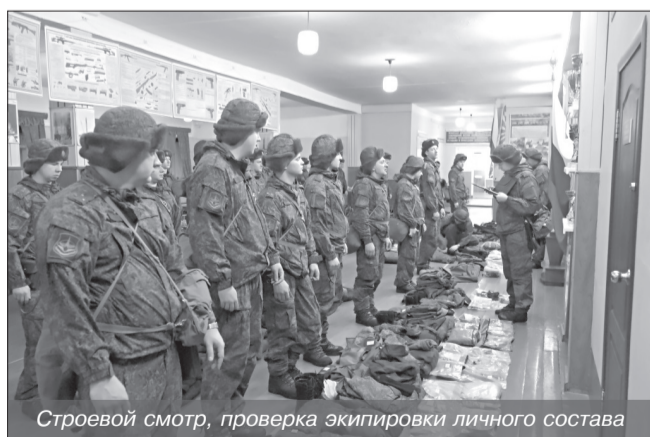
Строевой смотр, проверка экипировки личного состава

В период с 29 января по 2 февраля во всех воинских частях 1 ГИК МО РФ в соответствии с планом подготовки космодрома на 2018 учебный год прошли занятия и тренировки по боевой готовности