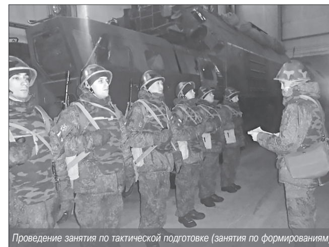
Проведение занятия по тактической подготовке (занятия по формированиям)