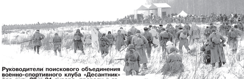
Руководители поискового объединения военно-спортивного клуба «Десантник» два дня, 20 и 21 января, провели в городке Шлиссельбург Ленинградской области. Поводом для их поездки стало приглашение на фестиваль-реконструкцию, посвященную 75-летию прорыва блокады Ленинграда. Это важное историческое событие произошло 18 января 1943 года

В первый день мирнинская делегация совершила экскурсию по городу, увидев своими глазами крепость Орешек, церковь и шлюз между Староладожским каналом и Ладожским озером, построенные еще во времена Петра Первого, а также башенные орудия с кораблей Балтийского флота, которые защищали Ленинград в годы Великой Отечественной войны.