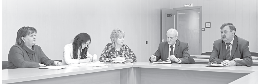
23 января состоялось заседание общественной муниципальной комиссии по реализации приоритетного национального проекта «Формирование комфортной городской среды» в муниципальном образовании «Мирный»

На заседании был утвержден план работы общественной муниципальной комиссии на период реализации мероприятий приоритетного проекта «Формирование комфортной городской среды» в 2018 году, а также утвержден организационный план мероприятий по проведению рейтингового голосования. Особенное внимание будет уделено работе с населением города по информированию и вовлечению горожан в реализацию программы с непосредственным участием в мероприятиях по выбору общественной территории для благоустройства в 2018 году и дальнейшую реализацию всех мероприятий проекта.