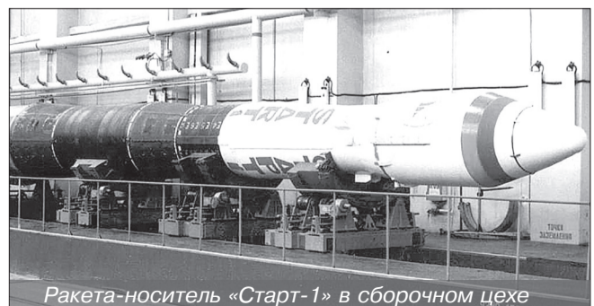
Ракета-носитель «Старт-1» в сборочном цехе