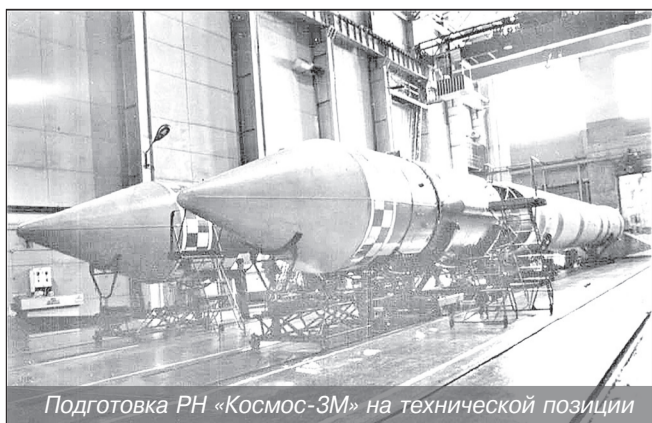
Подготовка РН «Космос-3М» на технической позиции

В статье использованы материалы, фото и фрагменты из: книга «Северный космодром России». Космодром «Плесецк». 2007 год; журнал «Новости космонавтики» №6 1995 года; информация открытых интернет-источников