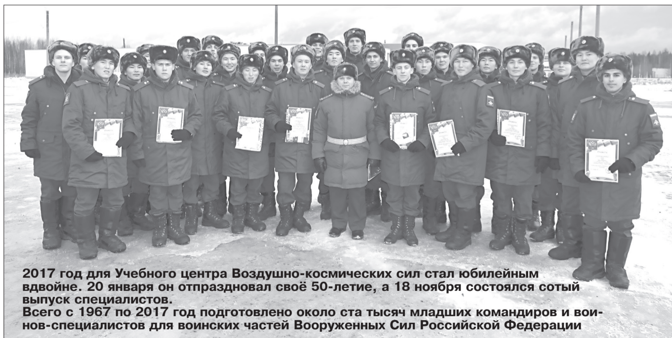
2017 год для Учебного центра Воздушно-космических сил стал юбилейным вдвойне. 20 января он отпраздновал своё 50-летие, а 18 ноября состоялся сотый выпуск специалистов. Всего с 1967 по 2017 год подготовлено около ста тысяч младших командиров и воин-нов-специалистов для воинских частей Вооруженных Сил Российской Федерации

Около тысячи юношей, прошедших становление в нашей части вышли на этот выпуск младшими специалистами по ряду востребованных специальностей: таких как электрики силовых электрических агрегатов и механики-водители многоосных дизельных автомобилей.