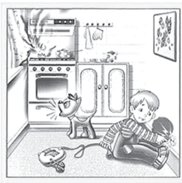
Не суйте пальцы в розетку