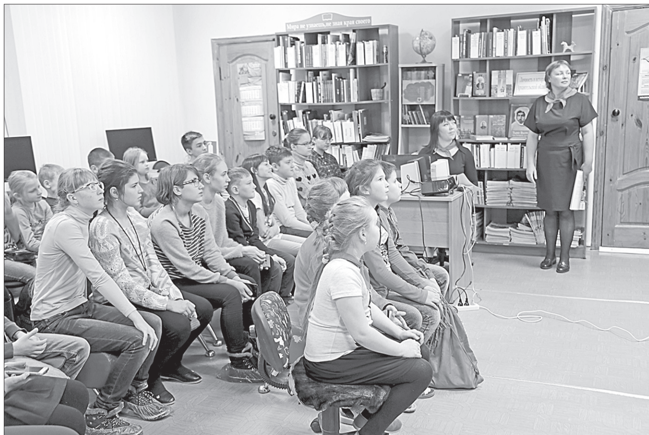
В читальном зале ребятам провели экскурс «Салют, Пионерия!» в пионерское детство. Юные зрители узнали о том, как создавалась коммунистическая организация работы с детьми того времени. Одни смогли примерить пионерский галстук - главный атрибут каждого пионера, другие впервые узнали о горне, барабане, пионерском значке и лагере «Артек».

В детской библиотеке для маленьких посетителей была подготовлена масса развлечений. Для детей тема столетия Октябрьской революции неизвестна, особенно для маленьких, поэтому сотрудники библиотеки постарались познакомить и малышей, и ребят постарше с историей этого события, литературой, которая их описывала, а также музыкой и искусством той эпохи.