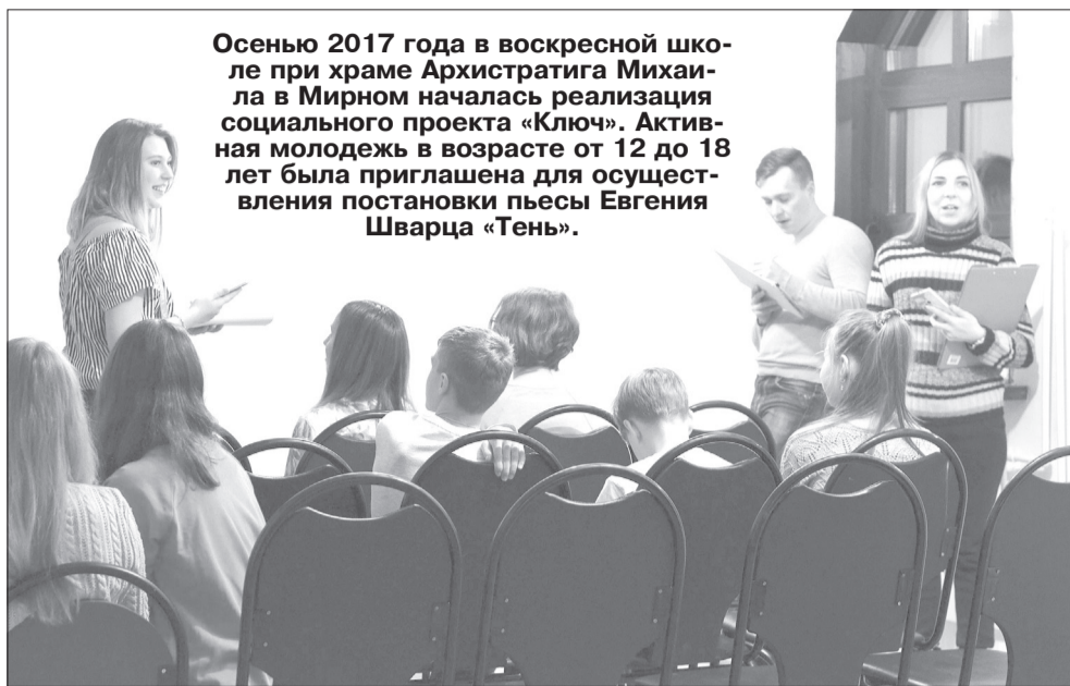
Осенью 2017 года в воскресной школе при храме Архистратига Михаила в Мирном началась реализация социального проекта «Ключ». Активная молодежь в возрасте от 12 до 18 лет была приглашена для осуществления постановки пьесы Евгения Шварца «Тень».

время интересно с любой категорией. Взрослые легче понимают, как правильно сыграть. Дети лучше запоминают тексты и чаще удивляют нас своим подходом. В то же время, общаясь с детьми, мы узнаем - о чем думает и чем дышит современная молодежь, зачастую они неплохо играют путем собственных выводов и догадок».