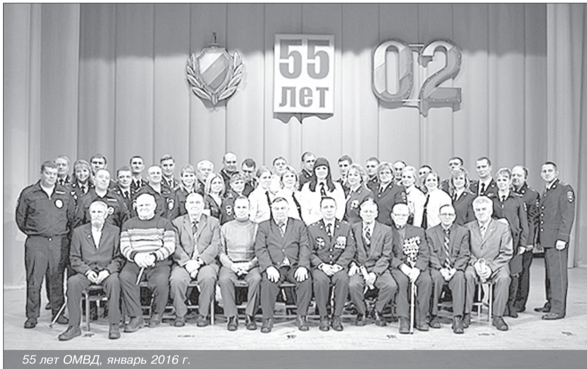
55 лет ОМВД, январь 2016 г.

Первый отдел милиции в Мирном был создан 17 января 1961 года и располагался он в начале улицы Лесной в маленьком одноэтажном щит-