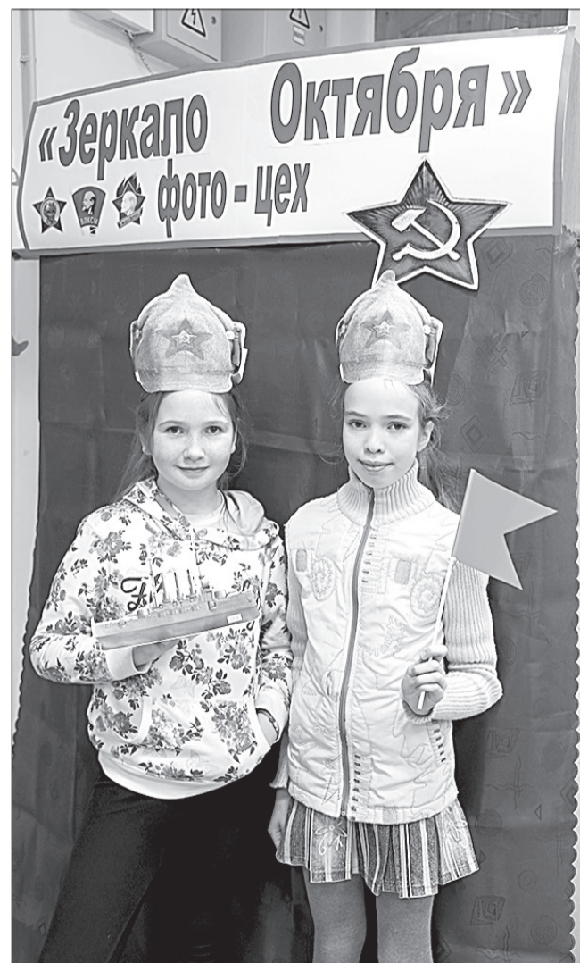
Одной из самых интересных «фишек» прошедшего мероприятия стала фотозона «Зеркало Октября». Ребята могли воспользоваться революционной атрибутикой и сделать интересное фото на память. Красные флажки, шапки-буденовки, красные галстуки - все это ребята с удовольствием использовали для необычного кадра.

Одна из зон библиотеки - абонемент, была оформлена плакатами революции. Плакаты того времени носили информативный характер, оперативно отзывались на злободневные события истории и могли в простой, доходчивой форме отразить перемены общественной жизни. Также гости абонемента могли ознакомиться с героями и военачальниками гражданской войны.