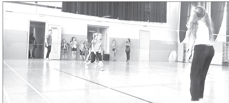
Соревнования проходили по трем возрастным группам: первая-2002-2004 года рождения, вторая - 2005-2006 года рождения, третья группа - 2007 год рождения и моложе.

Рекордное количество участников - более семисот - заявилось на Открытый областной юношеский фестиваль единоборств, проходивший 28-29 октября в Архангельске. Переполненные трибуны центра развития спорта «Норд Арена», азартные болевщички и яркие, техничные поединки на ринге, татами и борцовском ковре - здесь было на что посмотреть!