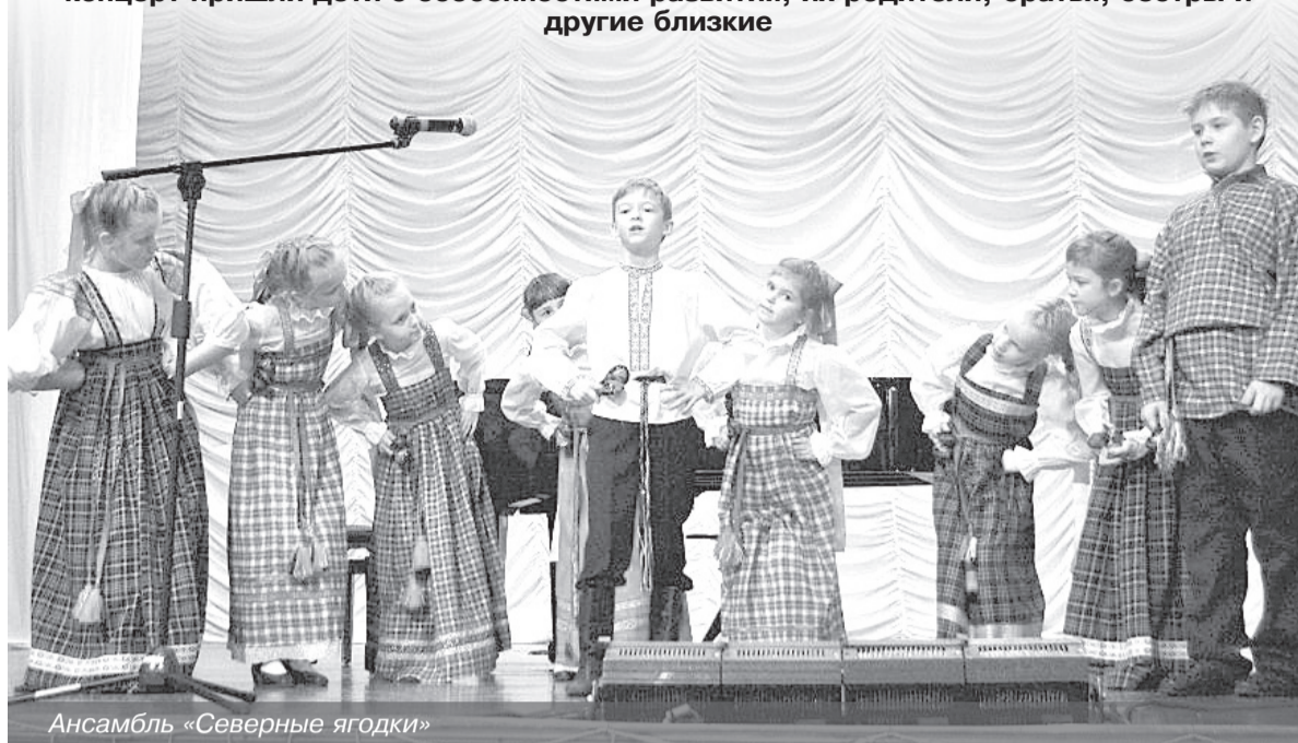
Ансамбль «Северные ягоды»

14 октября Детская школа искусств принимала гостей. На традиционный осенний концерт пришли дети с особенностями развития, их родители, братья, сестры и другие близкие