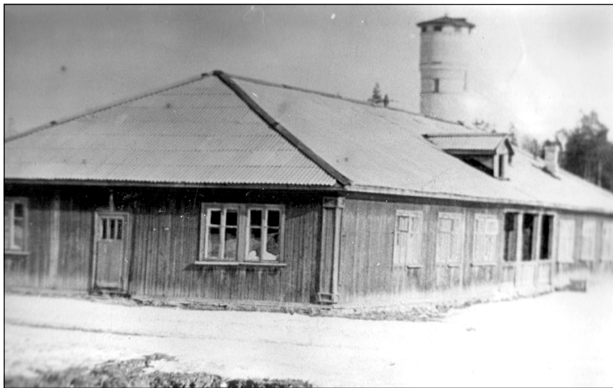
На фото: первое здание музыкальной школы по ул. Лесная. 1961 год

Красочной, многозвучной партитурой представляется культурное пространство Русского Севера. Свою особую нишу в этом пространстве занимает Мирнинская детская школа искусств. Главной миссией школы было и остается воспитание в детях любви к музыке, обучение игре на различных инструментах, пению, танцу.