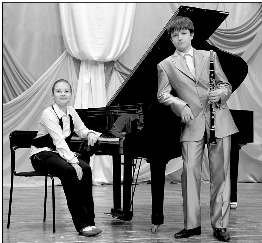
На фото: ансамбль «Парафраз». 2010 год