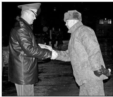
Грамота, рукопожатие и улыбка генерала дорогого стоят