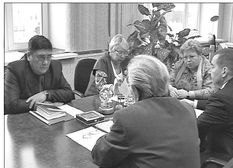
На фото: совещание под руководством министра здравоохранения и социального развития Архангельской области Ларисы Меньшиковой

25 ноября Мирный с рабочим визитом посетила министр здравоохранения и социального развития Архангельской области Лариса Меньшикова. За время своего пребывания в городе она провела целый ряд встреч и совещаний, на которых поднимались вопросы обеспечения жителей нашего города медицинскими услугами