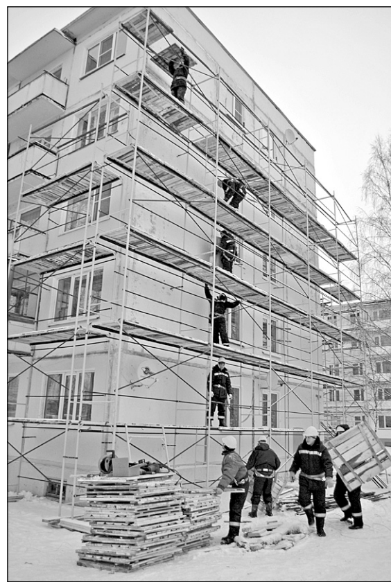
На фото: работы по устройству вентилируемых фасадов

Проблемным является вопрос перевода на природный газ 25 домов. Работы на этих домах были начаты еще в 2006-2008 годах по программе газификации Архангельской области, финансируемой из областного бюджета. Начиная с 2009 года государственные контракты были расторгнуты в связи с отсутствием финансирования, поэтому газификация этих домов приостановилась на значительный пе-