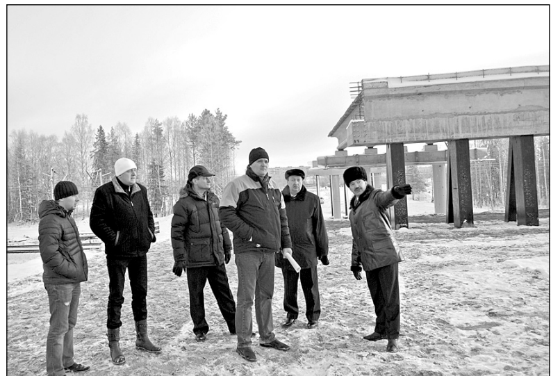
На фото: на объекте «Строительство автомобильного путепровода»