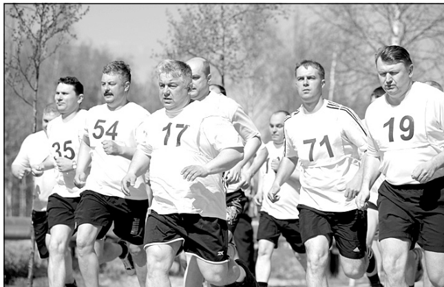
Офицеры управления сдают физо