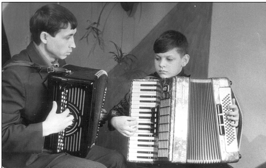
На фото: в классе баяна. 1979 год