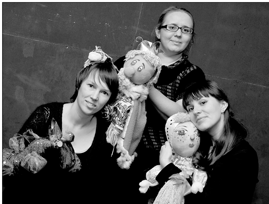
На фото: преподаватели театрального отделения ДШИ. 2010 год