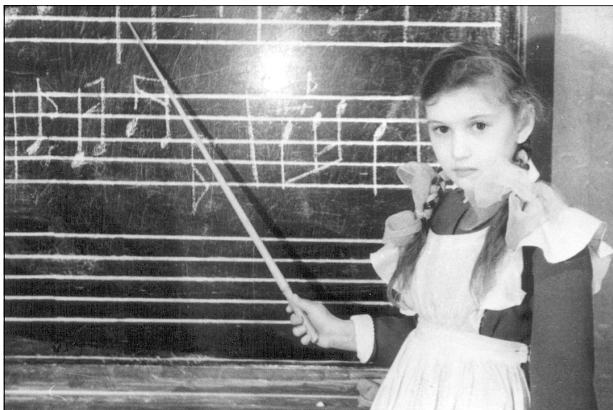
На фото: на уроке сольфеджио. 1986 год