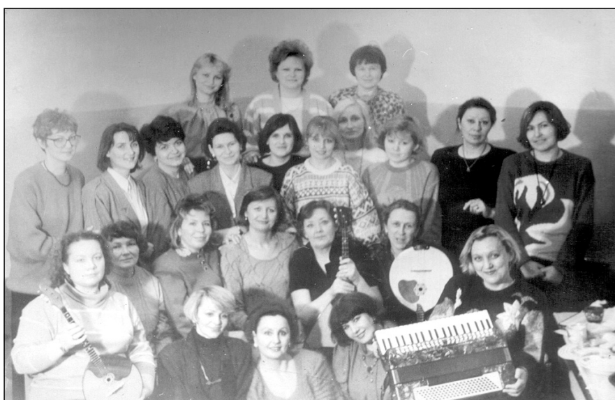
На фото: коллектив преподавателей ДШИ. 1995 год