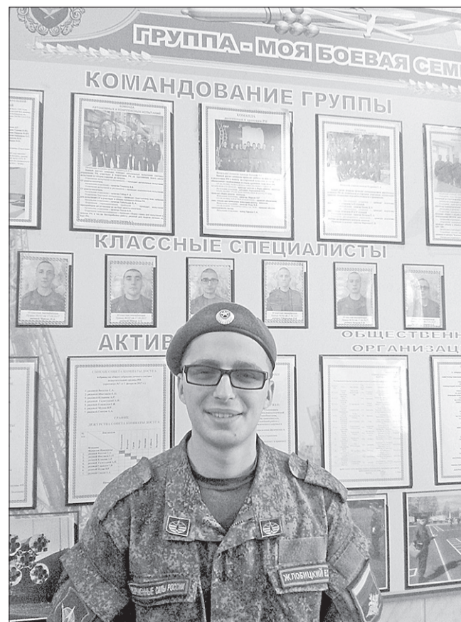
Механик отделения двигательных установок испытательной группы ракетноносителя рядовой Жло-

В моей должности на первый взгляд нет ничего сложного, ее я освоил быстро, но на ней лежит большой груз ответственности за общее дело, и это должен понимать каждый солдат нашей войсковой части 14056».