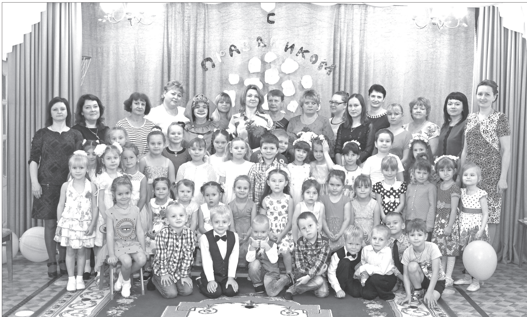
Наш детский сад любимый – веселая планета!

В минувшую среду эти слова услышали сотни работников дошкольного образования в Мирном. И эти слова были самыми искренними, ведь на самом деле в детских садах работают главные помощники родителей в деле воспитания детей