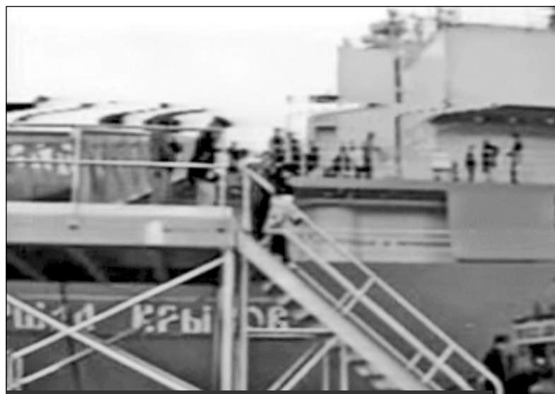
Корабль измерительного комплекса ВМФ России "Маршал Крылов" в Сиэтле. 1992 год

Космический аппарат "Ресурс-500", созданный на самарском предприятии "Прогресс" и принадлежащий группе частных компаний России,