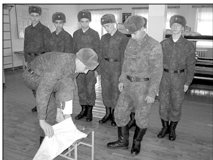
Никакие носки не спасут от мозолей лучше, чем правильно намотанные портянки

У новгородцев уже начинает все получаться - и кровать заправлять, и портянки наматывать, правда, еще не так быстро как положено, но все же намного лучше, чем в первый раз. Не устают они и подворотнички подшивать каждый день - понимают, что это важно для личной гигиены и здоровья. В строевой подготовке пусть пока еще достаточно ошибок, но все же первые уверенные шаги по плацу уже сделаны.