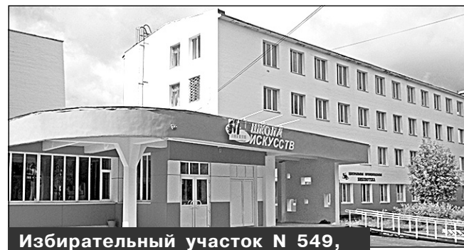
Избирательный участок N 549, г. Мирный, ул. Ленина, 38, Детская школа искусств

Место нахождения участковой избирательной комиссии и помещения для голосования: здание муниципального казенного образовательного учреждения дополнительного образования детей Детской школы искусств города Мирного Архангельской области, 1-й этаж, фойе школы.