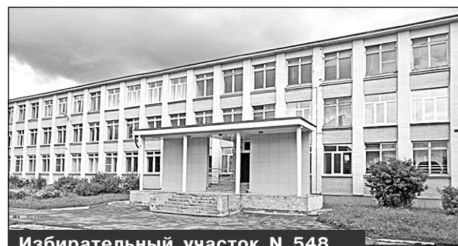
Избирательный участок N 548, г. Мирный, ул. Ломоносова, 18-А, МКОУ СОШ N 3

6. Избирательный участок N 548 , образованный по адресу: улица Ломоносова, дом 18-А, город Мирный Архангельской области.