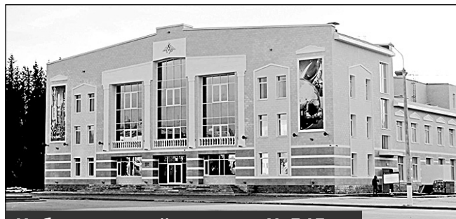
Избирательный участок N 545, г. Мирный, ул. Ленина, 22, Дом офицеров гарнизона

В границах избирательного участка расположены: