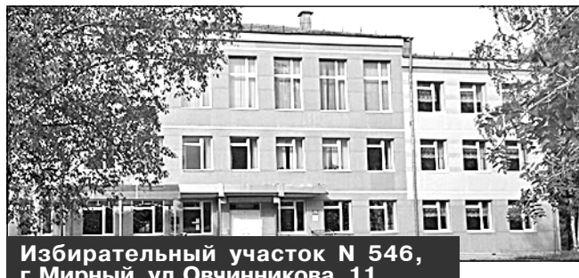
Избирательный участок N 546, г. Мирный, ул. Овчинникова, 11, МКОУ СОШ N 2

4. Избирательный участок N 546 , образованный по адресу: улица Овчинникова, дом 11, город Мирный Архангельской области.