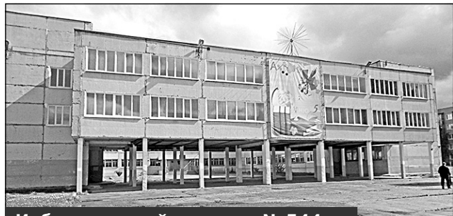
Избирательный участок N 544, г. Мирный, ул. Дзержинского, 8, МКОУ СОШ N 4

2. Избирательный участок N 544 , образованный по адресу: улица Дзержинского, дом 8, город Мирный Архангельской области.