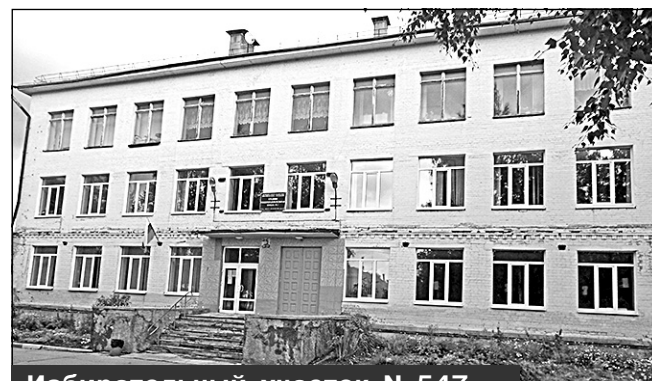
Избирательный участок N 547, г. Мирный, ул. Неделина, 28 (бывшее здание МБОУ СОШ N1)

5. Избирательный участок N 547 , образованный по адресу: улица Неделина, дом 28, город Мирный Архангельской области.