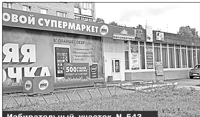
Избирательный участок N 543, г. Мирный, ул. Ленина, 9, ЦО "Перспектива"

Место нахождения участковой избирательной комиссии и помещения для голосования: встроенно-пристроенное помещение дома, некоммерческое образовательное учреждение "Центр образования "Перспектива", кабинет N 1, 1-й этаж.