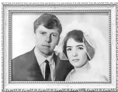
Татьяна ГАНЧИКОВА

Ровно пятьдесят лет назад, день в день, в Мирном появилась новая семья. Молодые Петр и Людмила начали долгий и светлый путь. И вот, спустя десятилетия они снова стоят здесь такие же счастливые, но уже в окружении детей и внуков. Цветы, улыбки и, конечно, поздравления - все в этот день на радость супругам Божковым.