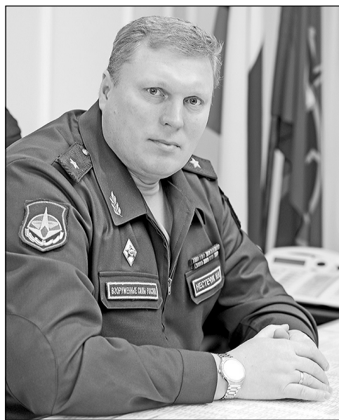
Начальник 1 ГИК МО РФ генерал-майор Николай НЕСТЕЧУК

В выходные на городском озере неизвестными был совершен акт вандализма: сожжен макет ракеты, которая была установлена на месте будущего фонтана, открытие которого планировалось приурочить к юбилею космодрома. Место выбрано не случайно и обусловлено историей архитектуры Мирного: в свое время именно здесь уже функционировал фонтан, так что возрожденный фонтан стал бы еще одним подарком для всех жителей Мирного - красивым местом отдыха и прекрасным дополнением к памятнику