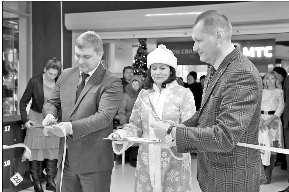
■ Пресс-служба главы Мирного

Большой продуктовый магазин торговой сети "Пять шагов" был торжественно открыт в Мирном 20 декабря. Этот объект стал очень уютным подарком городу в преддверии Нового года; особенно для жителей второго микрорайона - с продуктами магазинами в этой части города дела обстояли неважно.