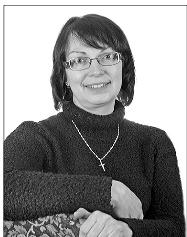
Как сложно иметь профессию, где нужно выполнять

множество заданий, причем относящихся к разным специализациям, уметь быстро переключаться с одного вида работы на другой и способность одновременно выполнять несколько поручений. Кто первый узнает о новых кадровых повышениях, знает все распоряжения и приказы? Конечно, секретарь руководителя!