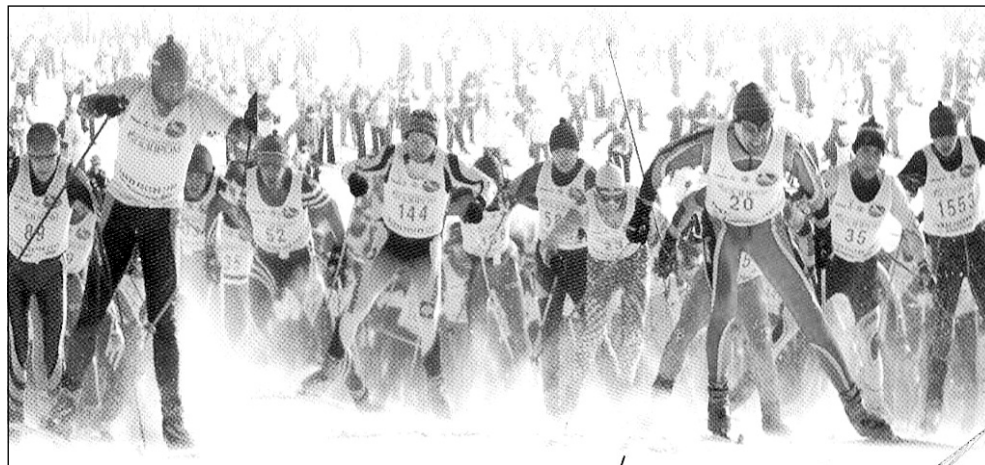
Приглашаем всех любителей лыжного спорта!

По вопросам участия обращаться в отдел культуры и спорта по тел.5-03-60