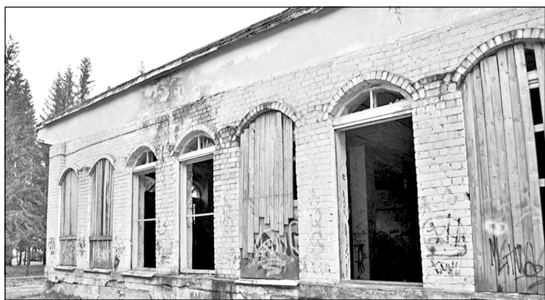
Сегодня на месте популярного в городе кафе "Орбита" остались одни руины. Фото 2015 года

Сегодня миряне ходят по выходным с детьми в "Миндаль" и "Аэлиту", праздники проводят в