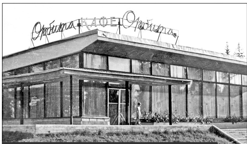
Первое кафе в Мирном - кафе "Орбита". Открыто в 1965 году. Фото 1970-х годов