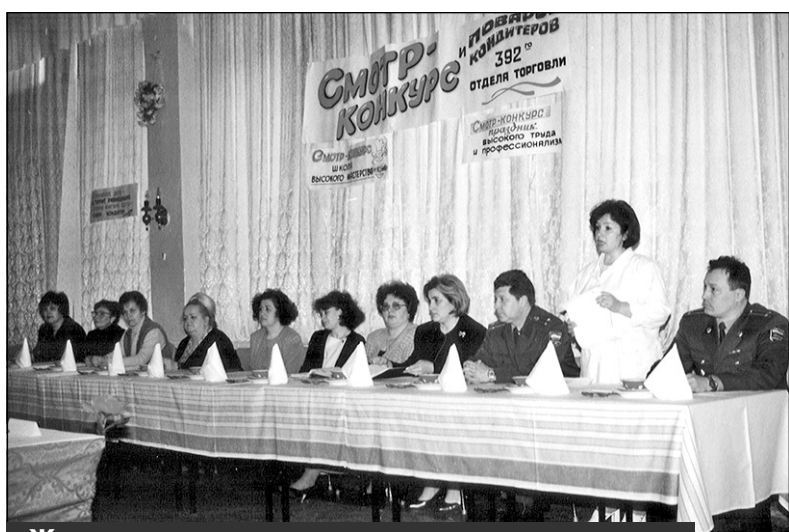
Жюри подводит итоги смотра-конкурса поваров и кондитеров 392-го отдела торговли Военторга в кафе "Орбита". Фото 1970-х годов