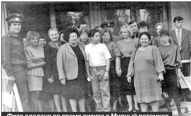
Фото сделано во время визита в Мирный потомков Романовых - наследника престола, цесаревича, Великого князя Георгия Михайловича с матерью - Главой Российского императорского Дома Великой княгиней Марией Владимировной. Июль 1994 года