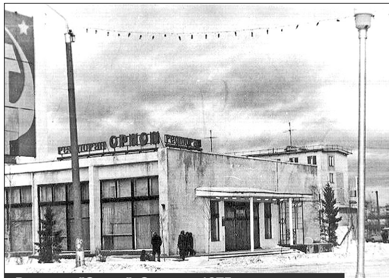
Ресторан "Орион". Открыт в 1975 году. Фото конца 1970-х - начала 1980-х годов

А на следующей фотографии мы видим место, которое неизменно ассоциируется со счастливым детством тех, кому сегодня уже по 30-40 лет. Изначально оно строилось и даже несколько лет работало как офицерский клуб, а затем стало детским кафе "Лукоморье". Оно было, действительно, сказочным благодаря своему деревянному оформлению "под избушку" и соответствующему внутреннему убранству. Был там отдельный стол "для дней рождений" - стоявший на возвышении, на своеобразной деревянной резной веранде. Но самое главное, едва открыв дверь в "предбанник" кафе, маленький горожанин попадал под очарование его волшебных запахов - пестушков на палочке и, конечно,