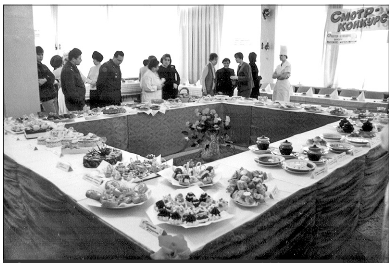
Смотр-конкурс поваров и кондитеров 392-го отдела торговли Военторга в кафе "Орбита". Фото 1970-х годов