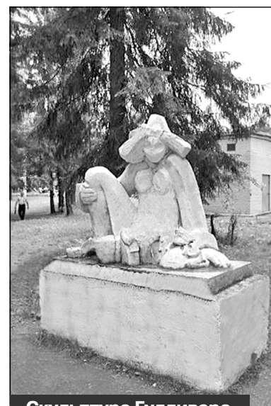
Скульптура Гулливера с лилипутами в парке. Часть фигуры разрушена вандалами