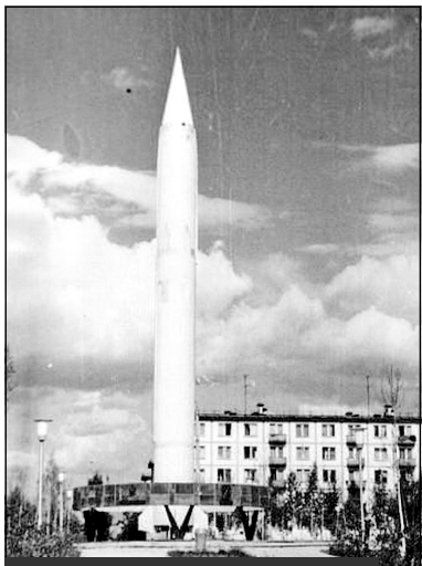
Мемориал - серийный образец стратегической ракеты Р-5. Открыт в честь 20-летия Ракетных войск

Из воспоминаний одного из жителей Мирного: "Эти аттракционы были рядом с нами. Мы жили на улице Ленина. И детей было не забрать домой. Да и мы,