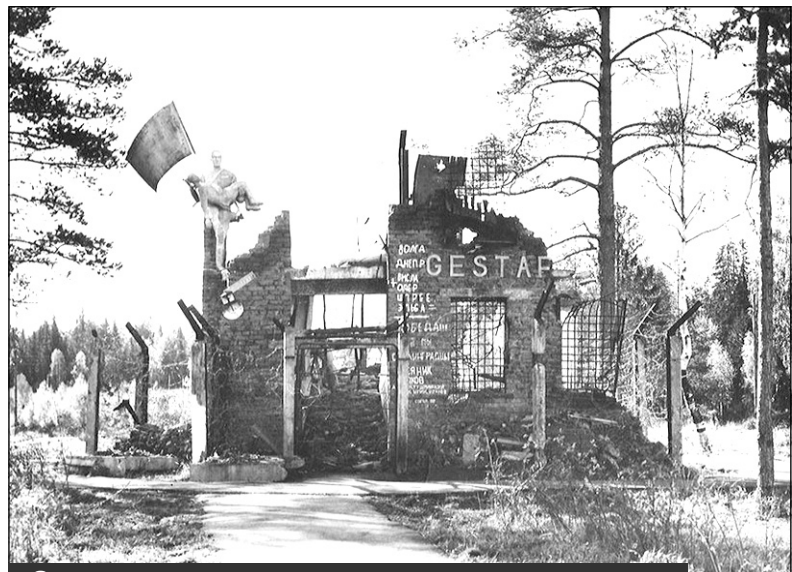
Скульптурная композиция штурма гестапо. Располагалась в парке Победы возле кинотеатра "Планета". Не сохранилась

нием возвышалась фигура советского офицера с поднятым вверх пистолетом. Внутри здания лежали муляжи убитых немцев и советских солдат.