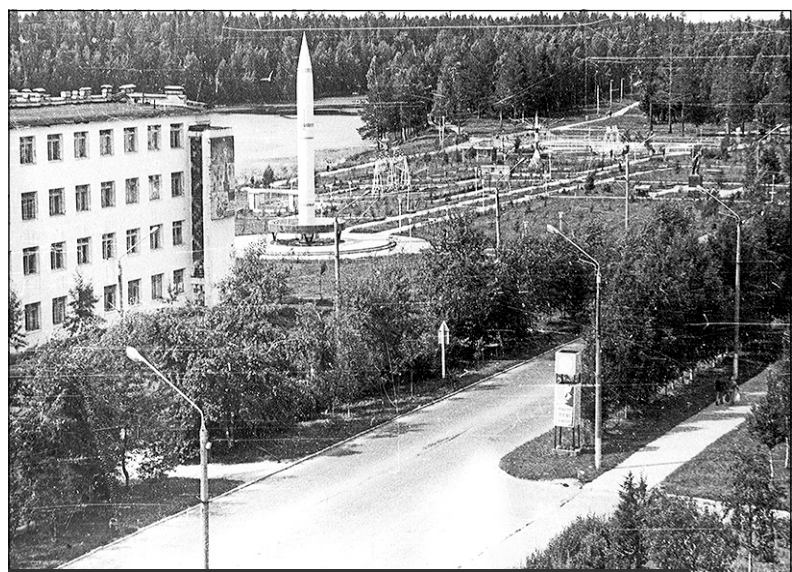
Панорама парка Победы. Фото в 1980-х годов