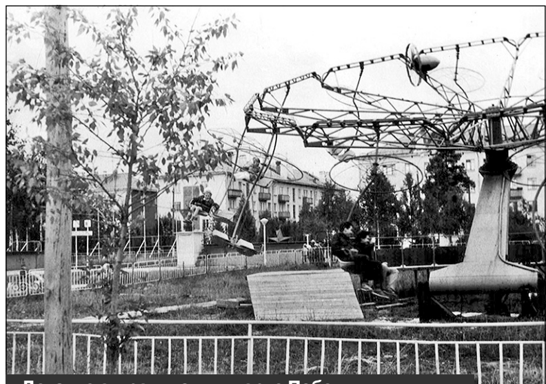
Детские аттракционы в парке Победы. Не сохранились. Снесены в 1990-х годах

Строительство этого необычного памятника началось сразу после празднования 9 Мая. По замыслу было решено изобразить, как советские воины-освободители уничтожают гитлеровское гестапо. Возводили этот шедевр (в полном смысле этого слова) солдаты строительных воинских частей. Основное строительство шло с мая по июль. Было построено здание гестапо, затем после окончания его возведения оно было взорвано, затем сожжено и расстреляно. Добивались абсолютной реальности. Здание по-настоящему было взорвано, затем его несколько раз сжигали, а затем расстреливали из автоматов, чтобы в стенах здания были видны застрявшие пули. Первоначально этот памятник выглядел так: разрушенное и обугленное здание гестапо, вокруг которого стояли скульптуры советских солдат разных родов войск, которые по замыслу и уничтожили этот рассадник зла, а сверху над зда-