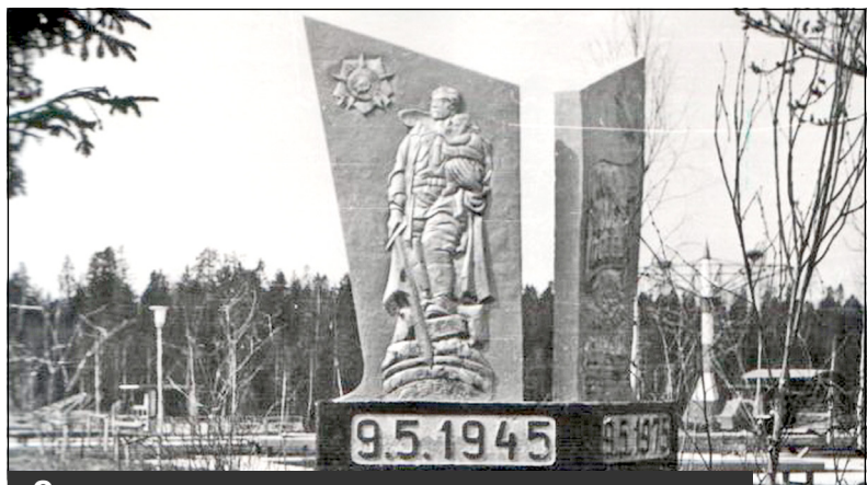
Скульптурная композиция, установленная возле парка Победы в честь 30-летия Великой Победы. Не сохранилась. Фото 1975 года