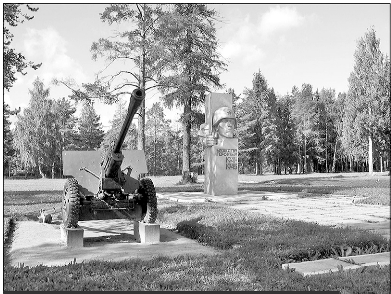
Памятник "Мужеству и героизму воинов 1941-1945 годов". Открыт 7 ноября 1978 года. Вид до реконструкции

детельствует фото празднования Масленицы 1974 года. Вот что пишет в социальной сети ВКонтакте один из старожилов города: "Масленица-74... И я со своими сыночками и дочуркой там был. Мы наблюдали за отважным, напористым парнем, который карабкался за подарком. А после дети катались на санях с лихим кучером. Было весело и радостно детям!!!"