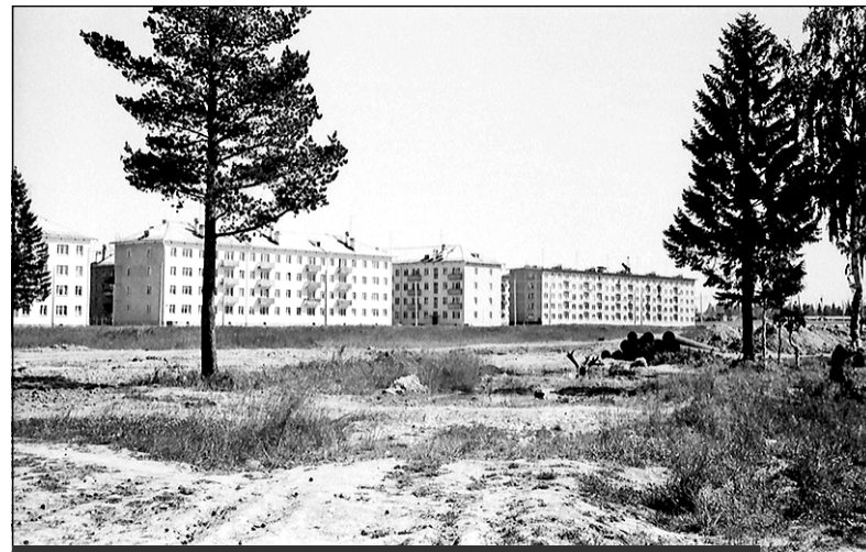
Именно такую картину можно было увидеть в 1960-х, если встать спиной к озеру справа от кинотеатра "Планета"

Парк Победы был заложен 9 мая 1975 года в честь 30-летия Победы советского народа в Великой Отечественной войне. В этот же день в парке был открыт памятник "Воину-Освободителю".