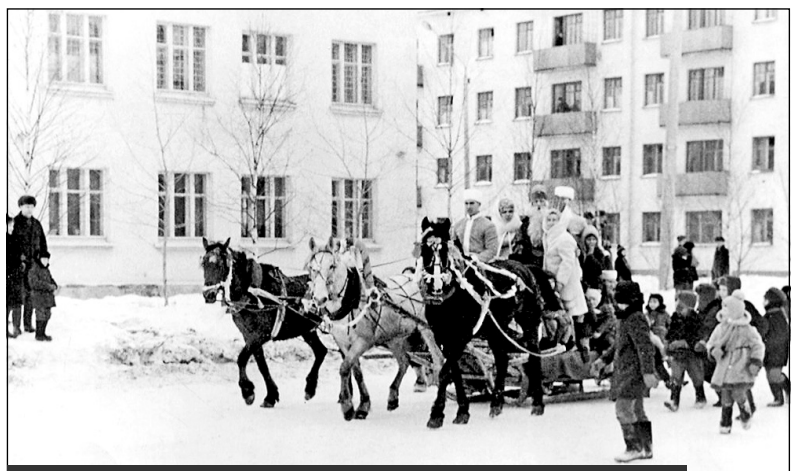
Катание на тройке на Масленицу. Фото 1970-х годов