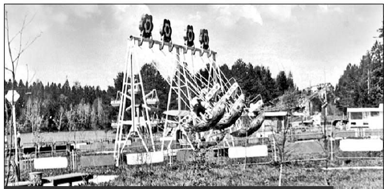
Детские аттракционы в парке Победы