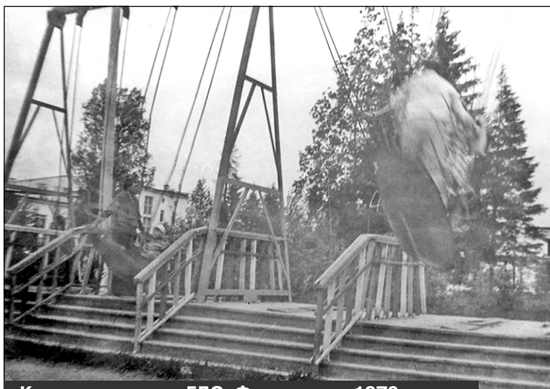
Качели-лодочки у ГДО. Фото начала 1970-х годов