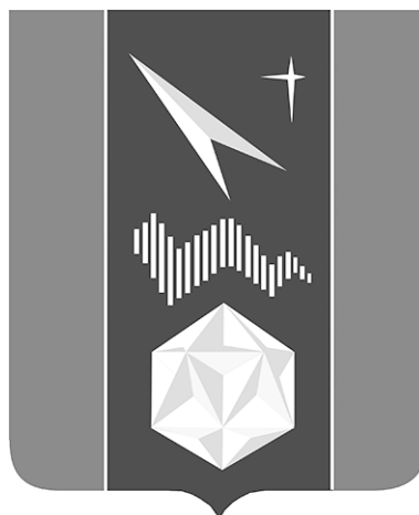
Герб города Мирный. В символике использовано стилизованное изображение памятника "Основателям гарнизона и города"