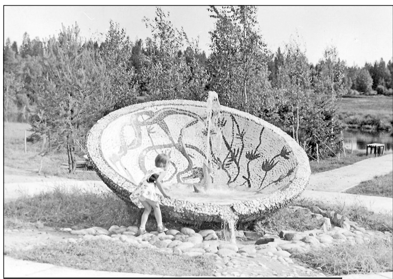
Фонтан в сквере "Юбилейный". Фото начала 1980-х годов