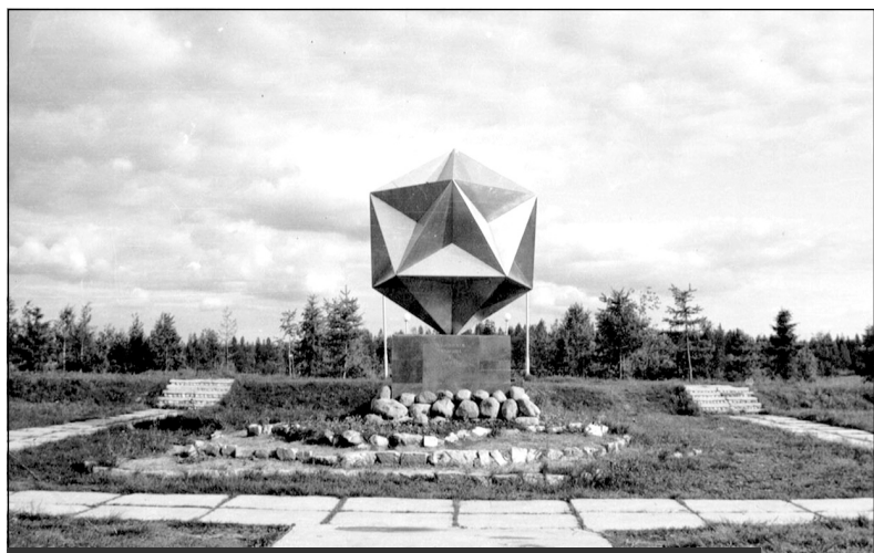
Памятник "Основателям гарнизона и города". Открыт 15 июля 1977 года. Фото конца 1970-х годов