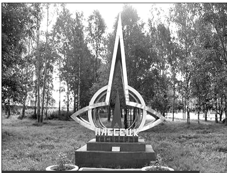
Стела "Космодром "Плесецк". Установлена в 2002 году