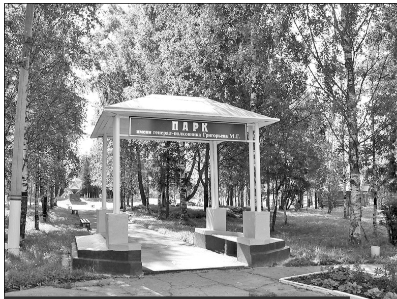
Вход в парк имени генерал-полковника М.Г.Григорьева. Был сквер "Юбилейный", переименован в 2002 году