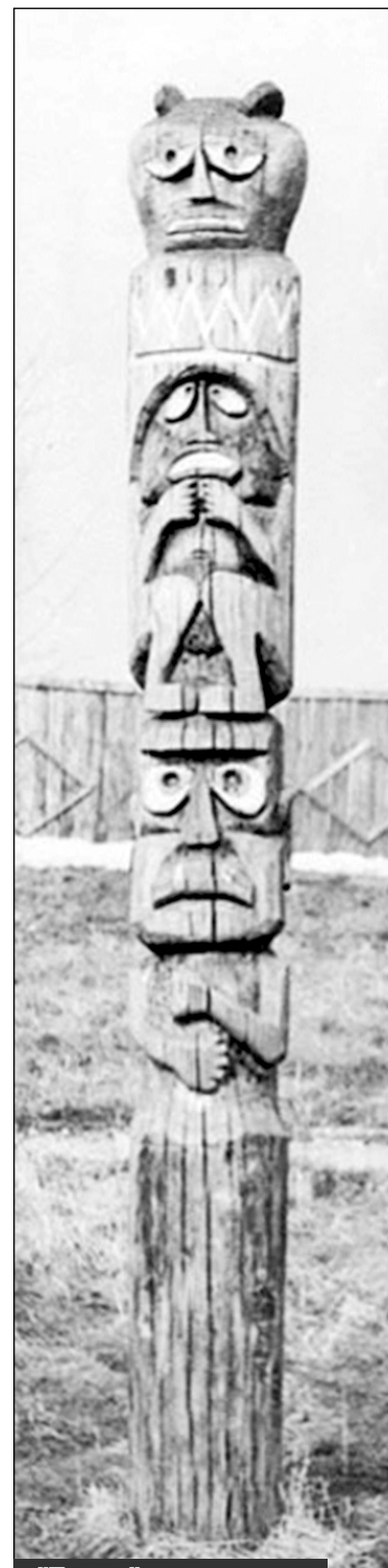
"Тотем" в сквере "Юбилейный". Фото начала 1980-х годов