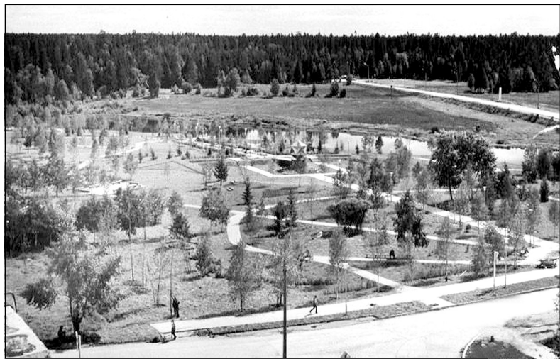
Сквер "Юбилейный". Фото начала 1980-х годов

Мы продолжаем публиковать исторический материал по истории города Мирный и космодрома "Плесецк" в рамках проекта "Космодром "Плесецк". Город Мирный. От былых времен до наших дней. 1957-2017", посвященного 60-летию космодрома