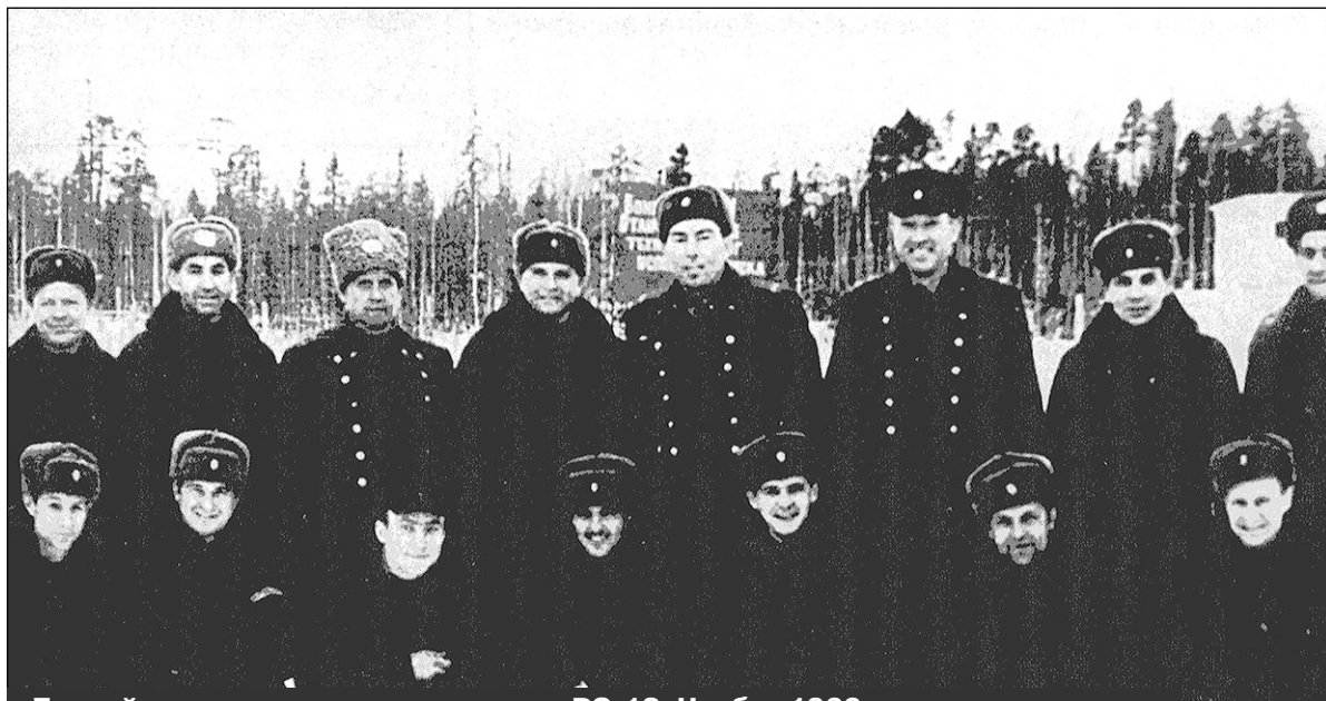
Боевой расчет первого пуска ракеты РС-12. Ноябрь 1966 года

Вспомогательными были машины и агрегаты обеспече-