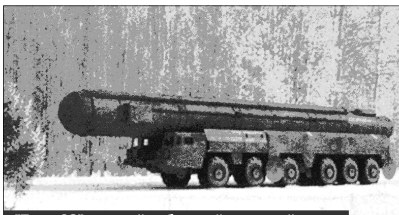
"Темп-2С" - первый мобильный грунтовый ракетный комплекс стратегического назначения с твердотопливной МБР