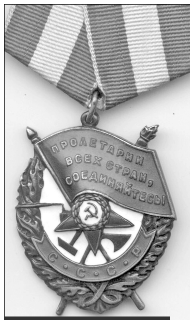
Орден Красного Знамени. Этим орденом Указом Президиума Верховного Совета СССР от 22 февраля 1968 года был награжден 53-й НИИП

Труд испытателей и всего личного состава полигона в Плесецке был отмечен командованием РВСН и руководством страны. 5 ноября 1967