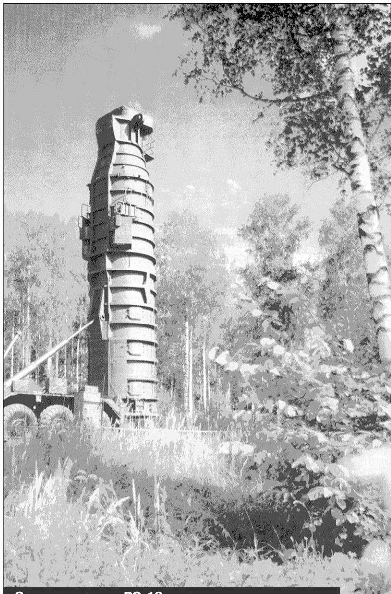
Загрузка ракеты РС-12 в шахтную пусковую установку

Мы продолжаем публиковать исторический материал по истории города Мирный и космодрома "Плесецк" в рамках проекта "Космодром "Плесецк". Город Мирный. От былых времен до наших дней. 1957-2017", посвященного 60-летию космодрома