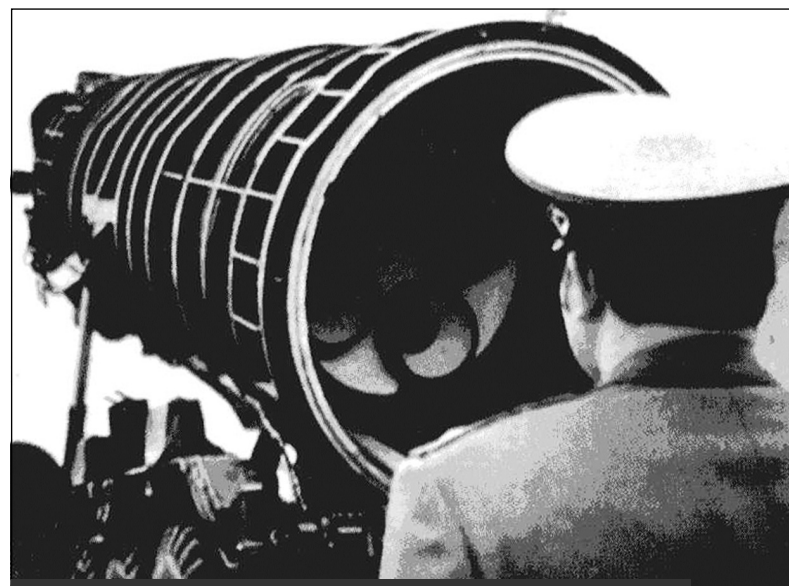
Установка второй и третьей ступеней ракеты РС-12 в шахтную пусковую установку

Для каждой машины была своя программа испытаний. Машины проверялись на проходимость, на износостойкость, на защищенность. Где их только не гоняли! Все эти испытания проходили, в основном, в ночное время суток. Ездить приходилось в хоккейных шлемах и самодельных защит-