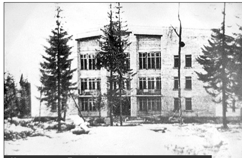
Новое здание Дома офицеров гарнизона. Фото 1963 года