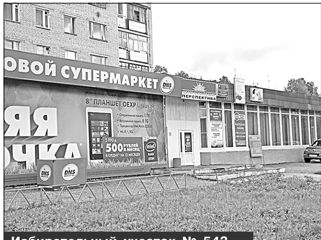
Избирательный участок № 543, г. Мирный, ул. Ленина, 9, ЦО "Перспектива"

Место нахождения участковой избирательной комиссии и помещения для голосования: встроено-пристроенное помещение дома, некоммерческое образовательное учреждение "Центр образования "Перспектива", кабинет N 1, 1-й этаж.