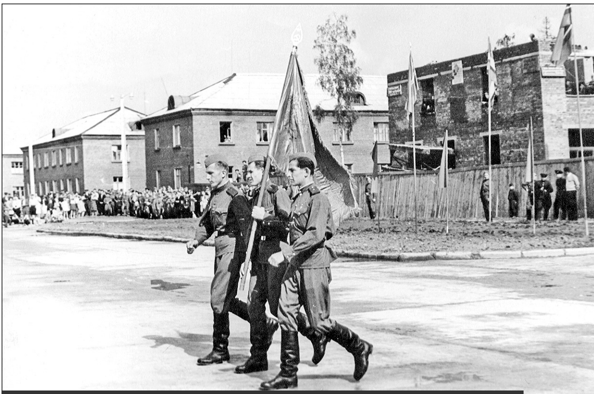
Парад войск гарнизона в поселке Мирный. Фото начала 1960-х годов