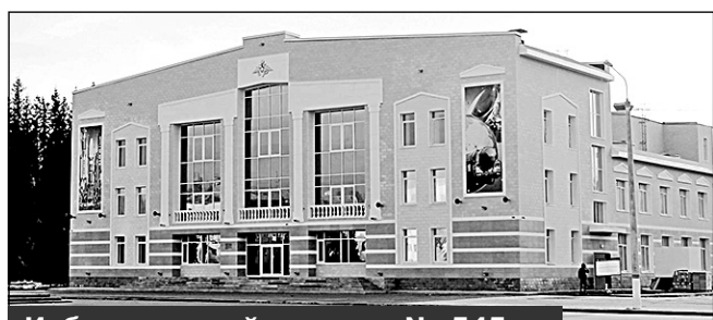
Избирательный участок № 545, г. Мирный, ул. Ленина, 22, Дом офицеров гарнизона

Место нахождения участковой избирательной комиссии и помещения для голосования: здание Федерального государственного казенного учреждения культуры и искусства Министерства обороны Российской Федерации (123-й Дом офицеров (гарнизона)), помещение танцевального зала, 3-й этаж.