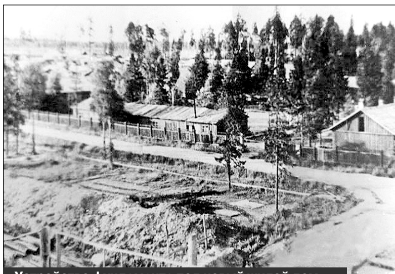
Устройство фундамента под новый жилой дом. Фото конца 1950-х - начала 1960-х годов

Поселок испытывал не только нужду в жилых домах, но и в объектах социального и культурно-бытового назначения, поэтому строились они параллельно со строительством жилья. В январе 1961 года был создан городской суд и образован отдел внутренних дел. Кстати, располагался он в одноэтажном деревянном здании в районе улицы Советская. В этом же году была образована центральная сберегательная касса. А 30 октября 1962 года начала работу городская контора связи, которая с 8 марта 1963 года начала оказывать услуги почтовой, телеграфной и телефонной связи. Открывались детские сады, магазины (продовольственный, готовой одежды, хозяйственный), гарнизонная баня. Первый магазин построили там, где до недавнего