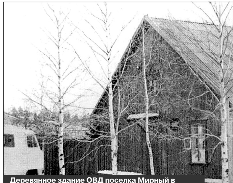
Деревянное здание ОВД поселка Мирный в районе нынешней улицы Советской. ОВД образован 17 января 1961 года. Фото начала 1960-х годов

Поселок быстро рос, в год сдавалось по несколько домов, построенных по современным в то время проектам. В 1958-1965 годах одновременно строились двухэтажные кирпичные дома по нынешним улицам Ленина, Мира, Пушкина, Октябрьская (ныне - улица Овчинникова), а также трехэтажные по улицам Октябрьская, Неделина, Пушкина и Мира. А на смену им уже торопились четы-