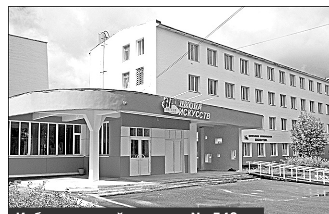
Избирательный участок № 549, г. Мирный, ул. Ленина, 38, Детская школа искусств

Место нахождения участковой избирательной комиссии и помещения для голосования: здание муниципального казенного образовательного учреждения дополнительного образования детей Детской школы искусств N 12 города Мирного Архангельской области, 1-й этаж, фойе школы.