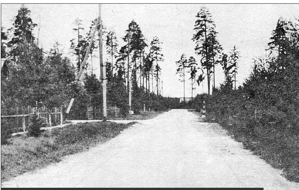
Одна из улиц поселка Лесное. Фото 1958 года

Архивные данные и воспоминания ветеранов позволяют ут-