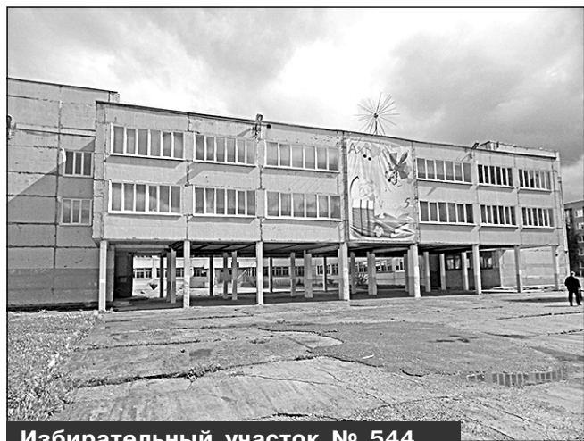
Избирательный участок № 544, г. Мирный, ул. Дзержинского, 8, МКОУ СОШ №4

Место нахождения участковой избирательной комиссии и помещения для голосования: здание муниципального казенного образовательного учреждения средней образовательной школы N 4 города Мирного Архангельской области, 2-й этаж, помещение актового зала.