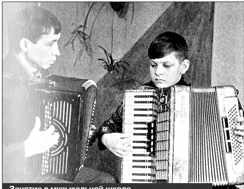
Занятие в музыкальной школе. Открыта 1 сентября 1961 года. Фото 1960-х годов

верждать, что гарнизонный Дом офицеров существовал в поселке с 1958 года. Известно, что уже в 1960 году был проведен смотр художественной самодеятельности Дома офицеров и войсковых частей. В нем приняло участие