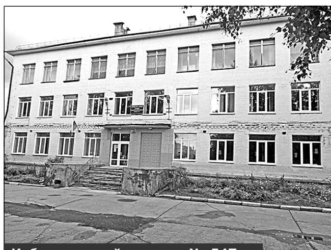
Избирательный участок № 547, г. Мирный, ул. Неделина, 28, МБОУ СОШ №1

Место нахождения участковой избирательной комиссии и помещения для голосования: здание муниципального бюджетного образовательного учреждения средней образовательной школы N1 города Мирного Архангельской области, 2-й этаж, помещение актового зала.