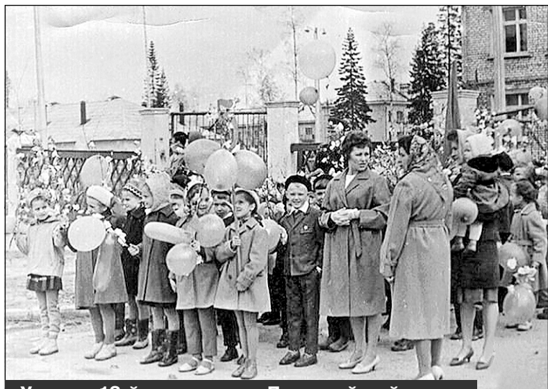
Ученики 12-й школы перед Первомайской демонстрацией. Фото 1964 года

В статье использованы материалы, фото и фрагменты из следующих источ-