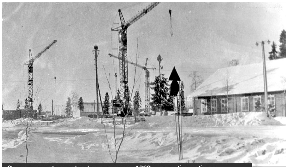
Отличительной чертой пейзажа в начале 1960-х годов было обилие строительных кранов. Фото начала 1960-х годов

Название Мирный появилось у поселка только осенью 1960 года. Тогда на основании Указа Президиума Верховного Совета РСФСР от 1 сентября 1960 года и решения Архангельского облисполкома от 23 ноября 1960 года на месте существующих населенных пунктов был образован поселок, которому дали название Мирный. Как появилось название Мирный, не помнят даже старожилов. Тогда, в конце 1950-х, многие строители и создатели будущего космодрома о войне знали не понаслышке. Редкое северное солнце переливалось блеском боевых орденов и медалей на кителях каждого второго. Ведь 1957 год от Великой Победы отделяли всего лишь двенадцать лет. И не им ли, первопроходцам космодрома, ни знать было