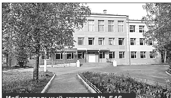
Избирательный участок № 546, г. Мирный, ул. Овчинникова, 11, МКОУ СОШ №12

Место нахождения участковой избирательной комиссии и помещения для голосования: здание муниципального казенного образовательного учреждения средней образовательной школы N 12 города Мирного Архангельской области, 1-й этаж, помещение спортивного зала.