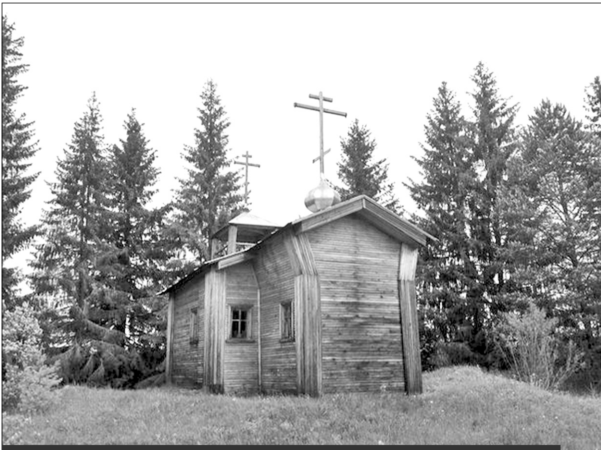
Часовня Святого Илии Пророка. Майнема, деревня Низ. Восстановлена в 2001 году. Фото 2015 года