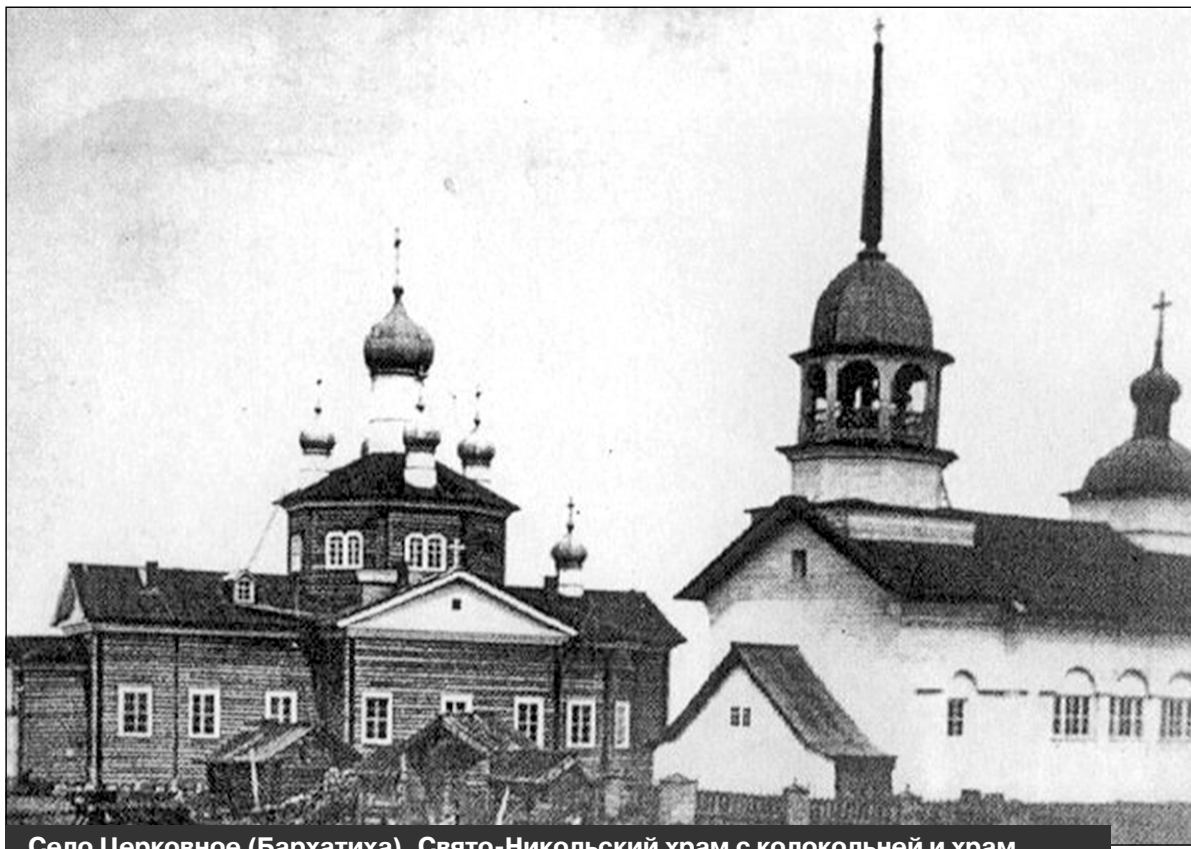
Село Церковное (Бархатиха). Свято-Никольский храм с колокольней и храм в честь Святой Троицы. Разобраны в 30-х годах XX века. Фото начала XX века

Мы продолжаем публиковать исторический материал по истории города Мирный и космодрома "Плесецк" в рамках проекта "Космодром "Плесецк". Город Мирный. От былых времен до наших дней. 1957-2017", посвященного 60-летию города и космодрома