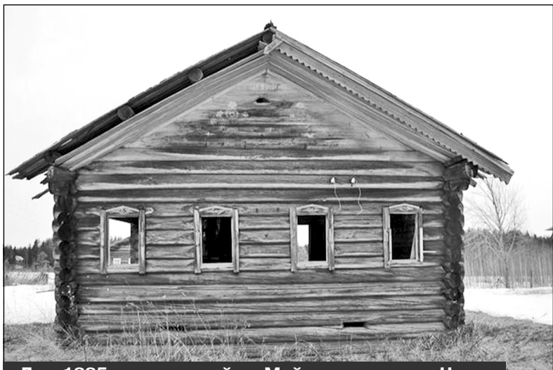
Дом 1885 года постройки. Майнема, деревня Низ. Фронтон дома был расписан вазами с вышивками цветами

рого мы рассказывали в предыдущих выпусках газеты "Панорама Мирного".