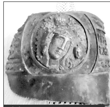
Обломок колокола из села Церковное. Из экспозиции музея школы в селе Тарасово

Так когда же были построены эти первые церкви - Николая Чудотворца и св.мучеников Флора и Лавра? Об этом можно судить лишь по приблизительным расчетам, так как никаких документов на этот счет не сохранилось. Если судить по грамоте митрополита Никона 1651 года, то церковь Флора и Лавра в деревне Весинская к этому времени была уже изрядно ветхой, а деревянные храмы стоят без ремонта 200-250 лет. Значит, построена она была в XV веке, также, вероятно, как и церковь Николая Чудотворца, стоявшая рядом. Известно, что по этой грамоте 1651 года обветшавшая церковь Флора и Лавра была разобрана и на ее месте возведен храм Святой Троицы с приделом Флора и Лавра. А что случилось с церковью Николая Чудотворца? Ни в одном документе мы не находим сведений, что он также был разобран. Возможно, он сгорел в 1613-1614 годах во время набегов польско-литовских отрядов, грабивших и разорявших Север Руси после поражения под Москвой. В 1693 году рядом с Троицкой церковью по грамоте митрополита Новгородского и Великолуцкого Корнилия на имя церковного старосты Антошки Михайлова был построен новый храм Николая Чудотворца. К сожалению, в 1789