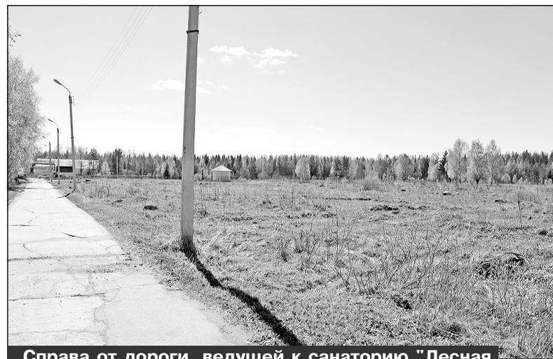
Справа от дороги, ведущей к санаторию "Лесная поляна", планируется построить торгово-развлекательный центр с мини-гостиницей