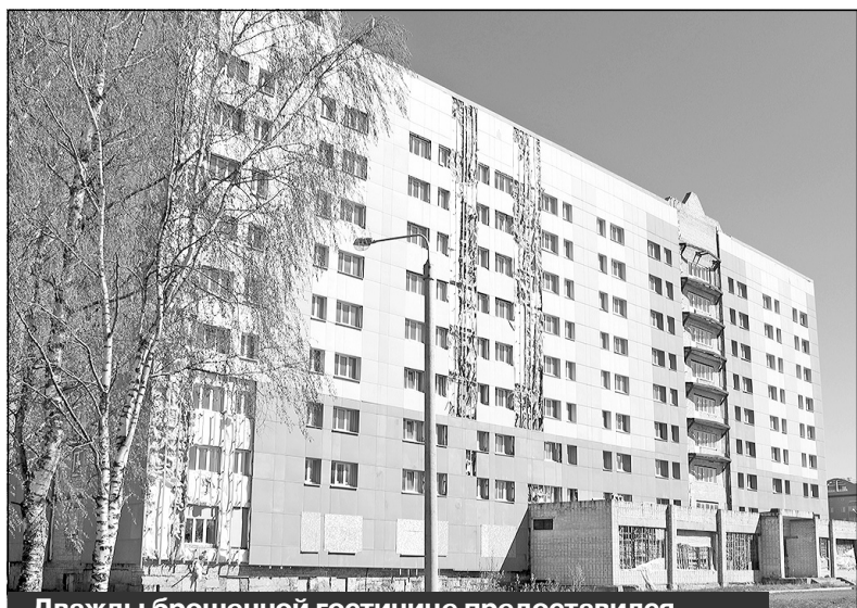
Дважды брошенной гостинице предоставился очередной шанс стать, наконец-то, обитаемой