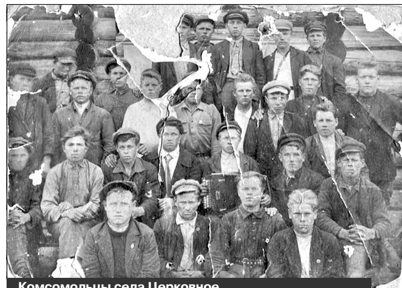
Комсомольцы села Церковное. Фото начала 1930-х годов

На следующий год после пожара, уничтожившего обе деревянные церкви в деревне Весинская, между деревнянами Васюковской и Юра-Гора была вновь отстроена на каменном фундаменте теплая деревянная одноглавая с двускатной кровлей Никольская церковь с теплым приделом Флора и Лавра. Храм внутри украсил четырехъярусный иконостас. В 1863 году обе церкви и колокольня были обнесены деревянной оградой длиной более 400 метров. В украшении храма много