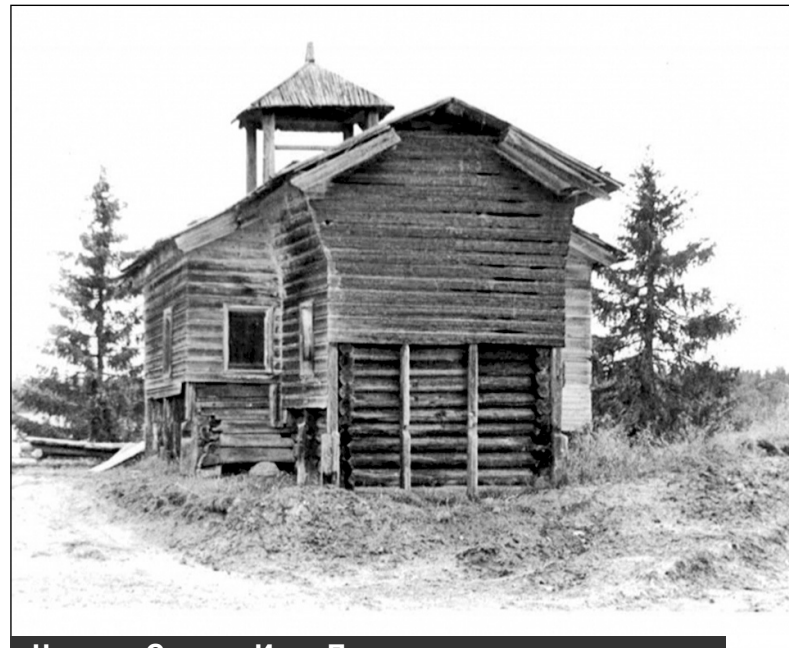
Часовня Святого Илии Пророка. Майнема, деревня Низ. Фото 1975 года

деревне Норкинской приняли решение о строительстве приписной церкви во имя Святого Пророка Илии вблизи существующей Ильинской часовни. Строительство церкви было вызвано отдаленностью Майнемы от приходских церквей (ближайшая деревня от прихода находилась в 12 верстах, дальняя - в 30), и тем, что в Майнемской трети проживало 426 человек. В приговоре крестьян было особо оговорено: "Вырубку же и доставку леса на место постройки, а равно и доставку потребного количества камня мы охотно берем на себя...". Имелся и начальный капитал в 236 рублей, которого, конечно, было недостаточно. Несмотря на то, что на крестьянских сходах сбор средств на строительство церкви постоянно продлевался, денег все равно не хватало и строительство церкви постоянно приостанавливалось. Лишь в декабре 1909 года церковь была достроена, были "срублены стены и отесаны, сделаны потолки и черные полы... устроена глава и поднят на нее крест деревянный... Внутренняя отделка храма отложена впрямь до приискания средств...". Но в 1910 году не уродился хлеб и "по бедности жителей означенной местности..." на внутреннюю отделку и устройство иконостаса средств опять не оказалось, а на работы требовалось ни много ни мало 1000 рублей. Не удалось со-