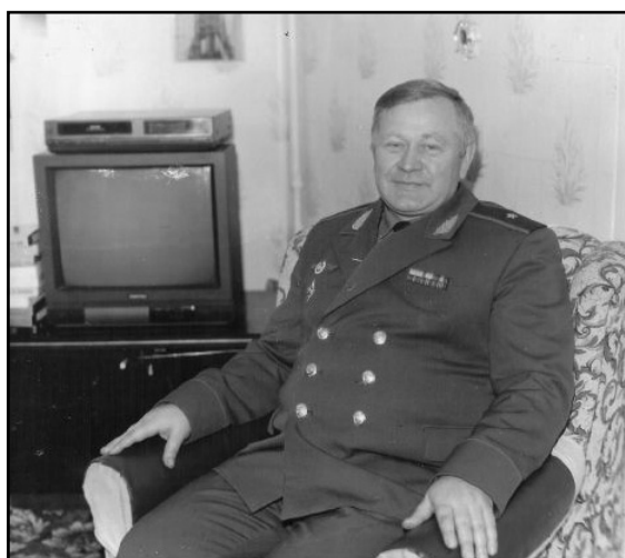
Генерал дома в редкие минуты отдыха

космических средств. Вложив частичку своей души в возведение памятника, военнослужащие не только отдали дань уважения и памяти первому начальнику космодрома, но и приняли непосредственное участие в патриотическом воспитании юного поколения села Федово. Ведь узнавая