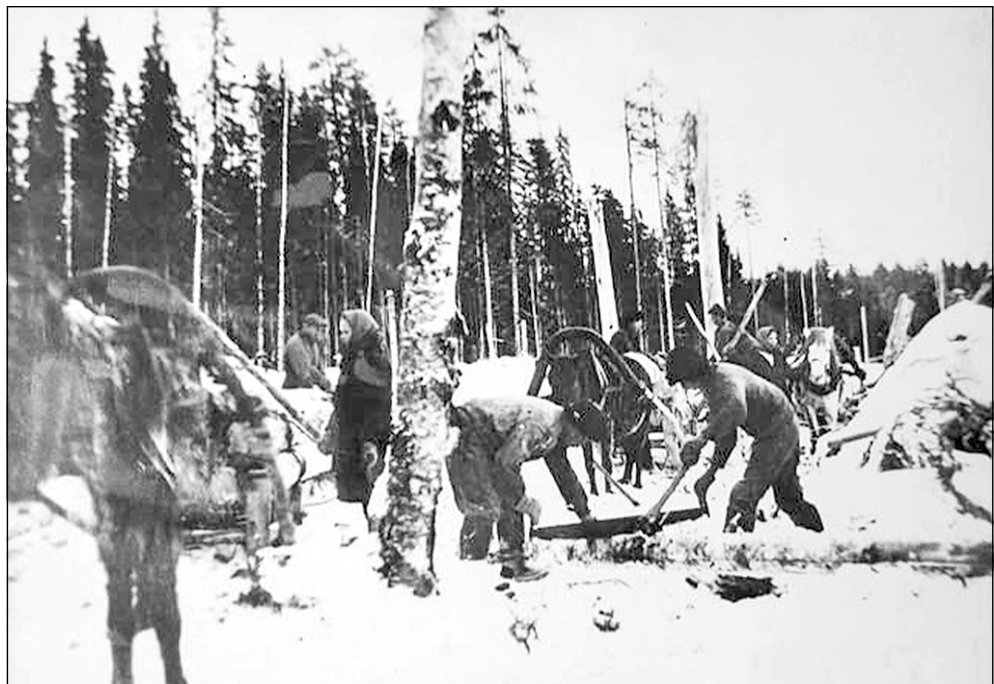
Спецпереселенцы на лесозаготовках. Северный край. Фото 1930-х годов. Архангельский областной краеведческий музей