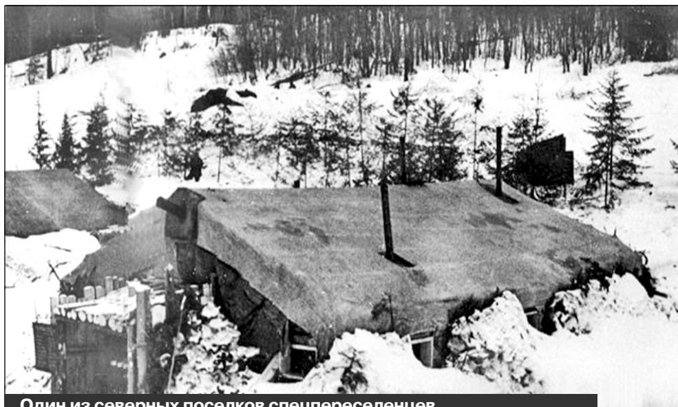
Один из северных поселков спецпереселенцев

Ижожка до осени 1959 года. За это время на территории лесозавода в Плесецке для них были построены брусчатые дома. Другая часть переселилась в Шелексу. В родные места из бывших спецпереселенцев Ижожи почти никто не вернулся.