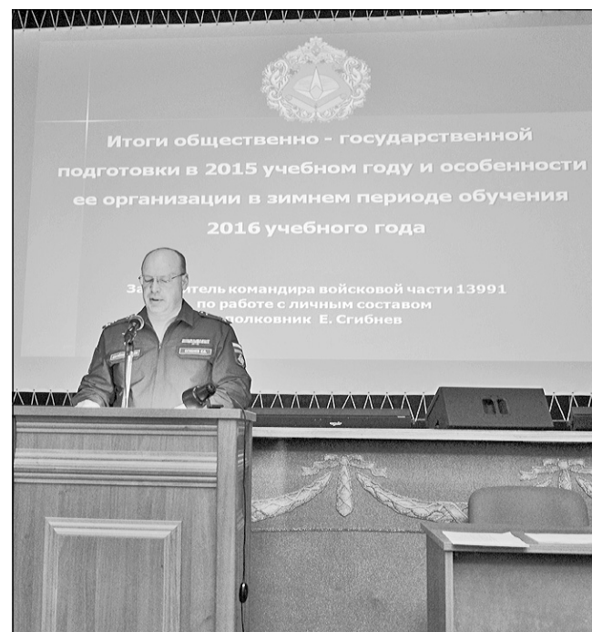
25922). Восемью специалистам объявлены благодарности.