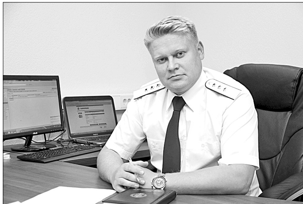
ра, новых трудовых достижений, удачи во всех делах и начинаниях!

Желаю вам крепкого здоровья, счастья, семейного благополучия, мира и доб-