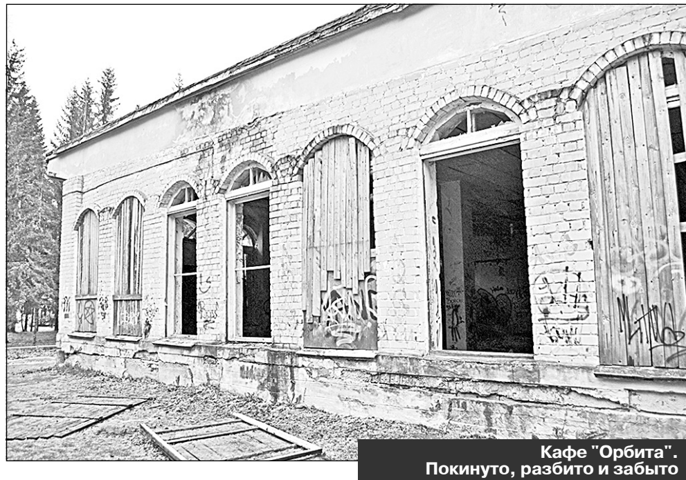
Кафе "Орбита". Покинута, разбита и забыта

Так и хочется обратиться к неведомым устроителям этого недвижимого беспредела: если вам принципиально жалко отдавать здания городу, так снесите их совсем; есть мысли продать - продавайте, только кому теперь нужны ваши развалины; собираетесь использовать сами - используйте, да побыстрей.