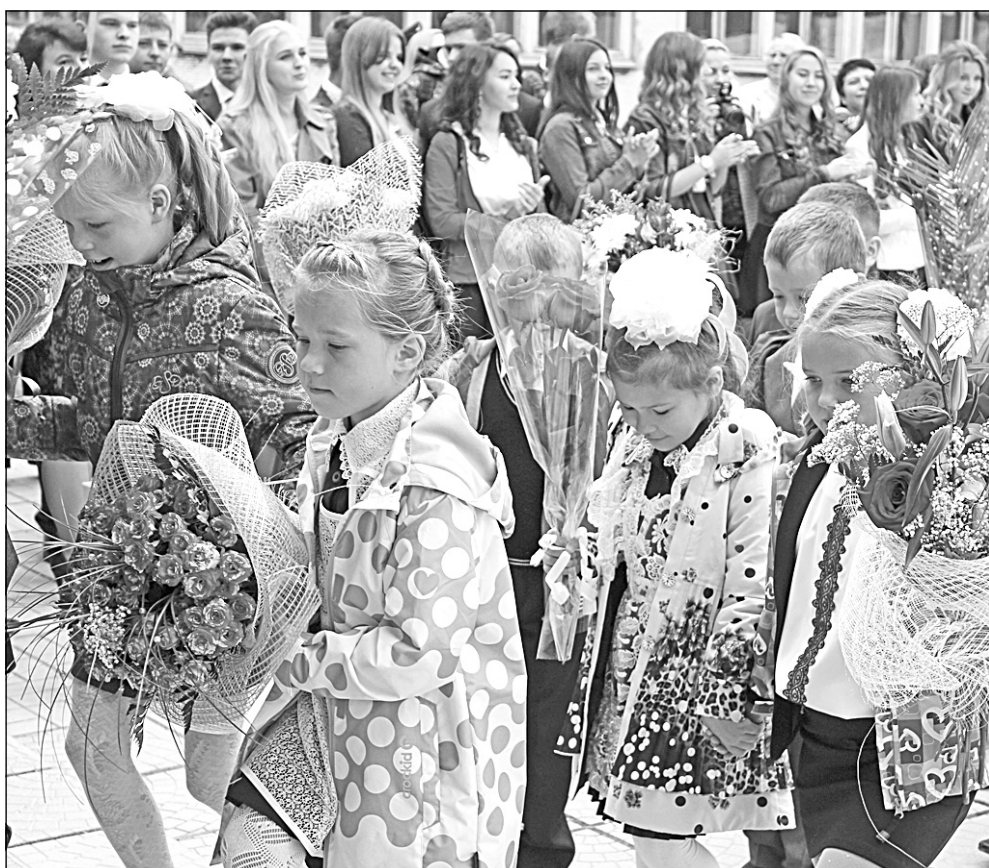
■ Пресс-служба главы Мирного

Одним из главных событий прошедшей недели стал праздник, посвященный началу нового учебного года. Первое сентября - "Новый год" для школьников, студентов, учителей и родителей. Торжественные линейки прошли во всех школах города. В этом году школы приняли 3333 учащихся, из них 366 первоклашек и 188 выпускников