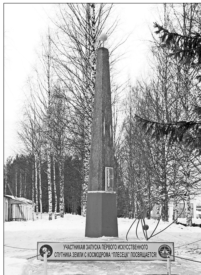
УЧАСТНИКАМ ЗАПУСКА ПЕРВОГО ИСКУССТВЕННОГО СПУТНИКА ЗЕМЛИ С КОСМОДРОМА "ПЛЕСЕЦК" ПОСВЯЩАЕТСЯ!

Прошло 49 лет с момента первого пуска искусственного спутника Земли из северных широт России, но и сегодня космодром "Плесецк" славен своими достижениями в деле освоения ракетно-космической техники, ведь космическую биографию 1ГИК МО пишут новые поколения военных и гражданских специалистов. И можно с уверенностью сказать, что страниц в этой биографии будет ещё много.