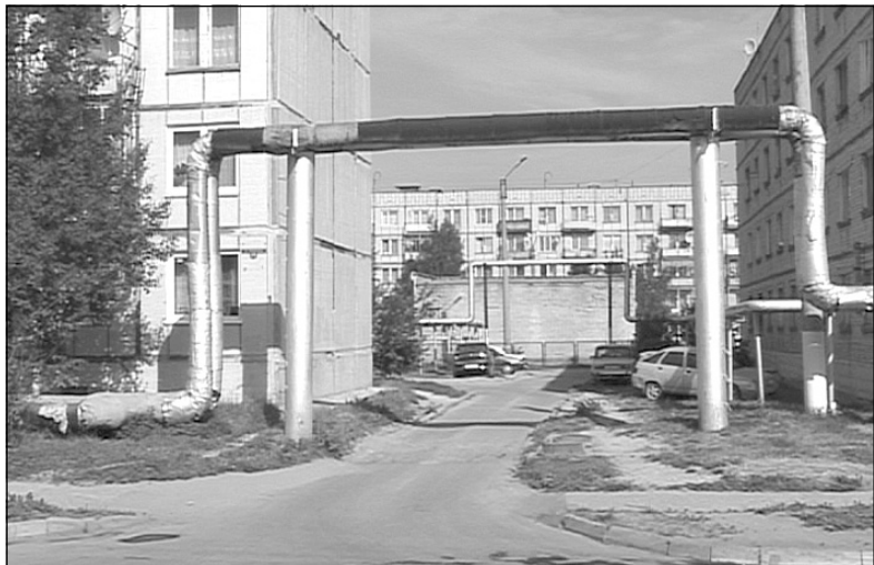
На фото: Заменен воздушный клапан на компенсаторе около дома №15 на улице Советской

В теплоснабжении можно выделить два главных технологических процесса - производство тепла и перенос его к месту потребления. Последняя функция осуществляется с помощью теплосетей. Только при полном отключении воды возможны основные работы по их ремонту и обслуживанию. Именно этим и занимались специалисты в течение десяти дней. Об этом мы поговорили с начальником участка «Тепловые сети» и аварийно-диспетчерской службы Владиславом Ковтуном.