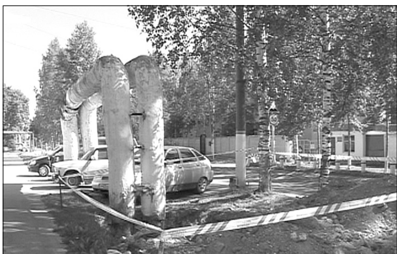
На фото: Устранена течь на подземной магистрали около дома №9 на улице Мира

- Владислав Владиславович, какие работы были проведены вашим участком в период отключения воды?