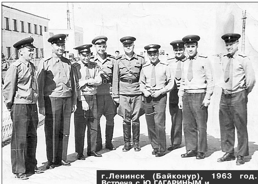
г. Ленинск (Байконур), 1963 год. Встреча с Ю. ГАГАРИНЫМ и Г. ТИТОВЫМ на стартовой позиции