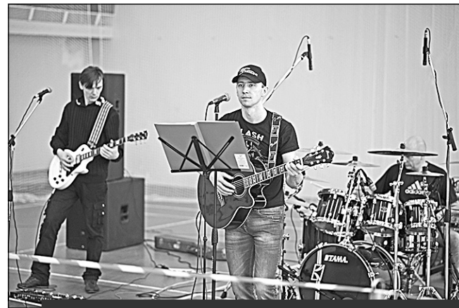
Песня не только строить и жить помогает... Группа «20 12» поздравила победителей