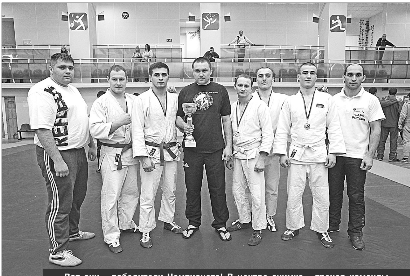
Вот они - победители Чемпионата! В центре снимка - тренер команды, справа и слева - строгие и справедливые судьи

Пользуясь случаем, поздравляем спортсменов нашего космодрома с заслуженной победой!