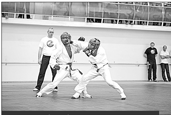
Нелегким был бой за каждый рекорд