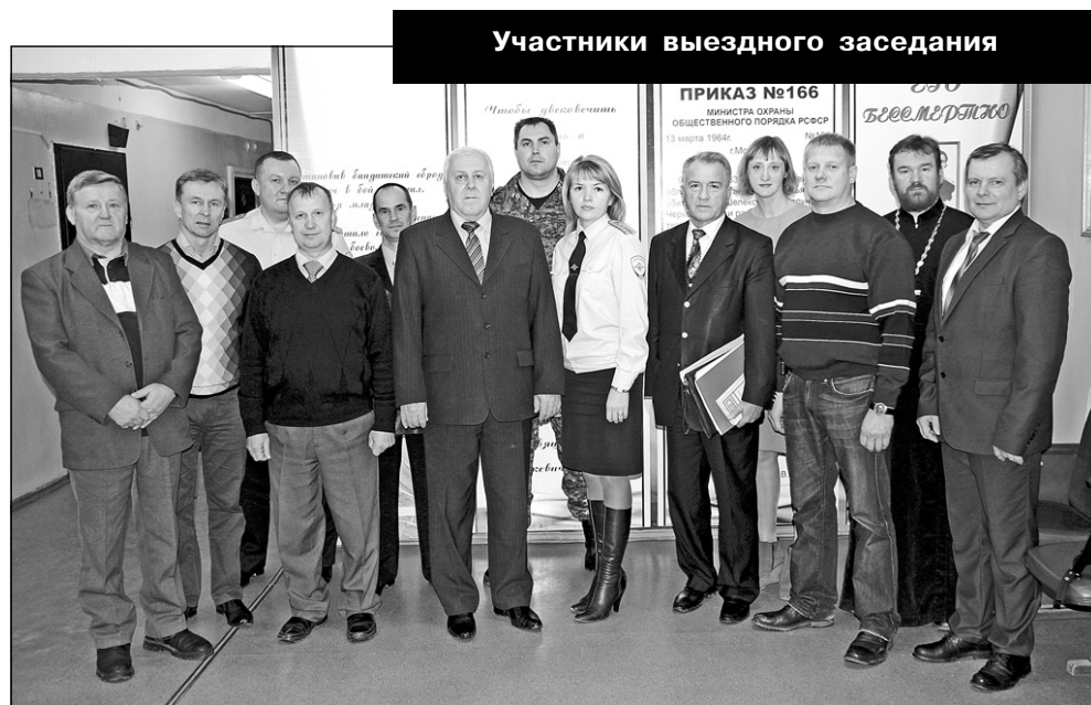
Участники выездного заседания