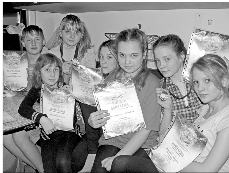
Фото: Дипломанты II Всероссийского конкурса-лаборатории г. Серпухов

Город Мирный в этой номинации представили 5 дев-