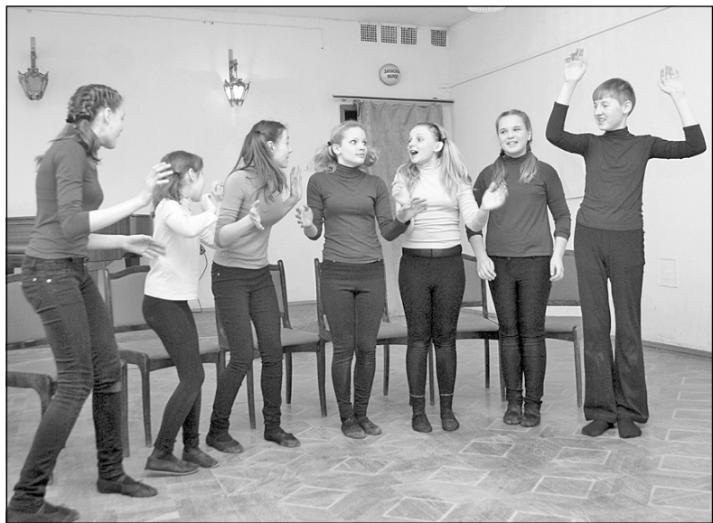
Фото: Урок вежливости

ли спать, окутывая спокойным сном. Суэта начала и первые ощущения