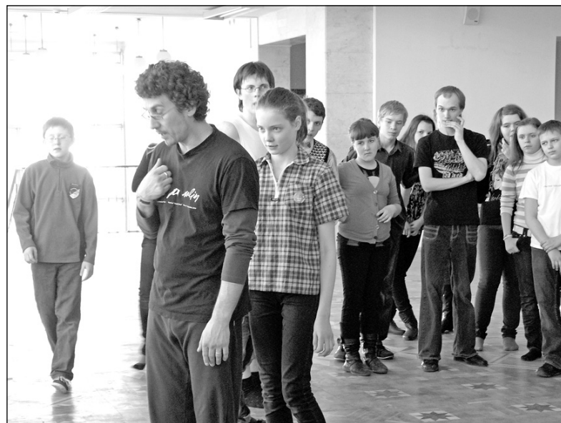
Фото: Тренинг по сценическому движению